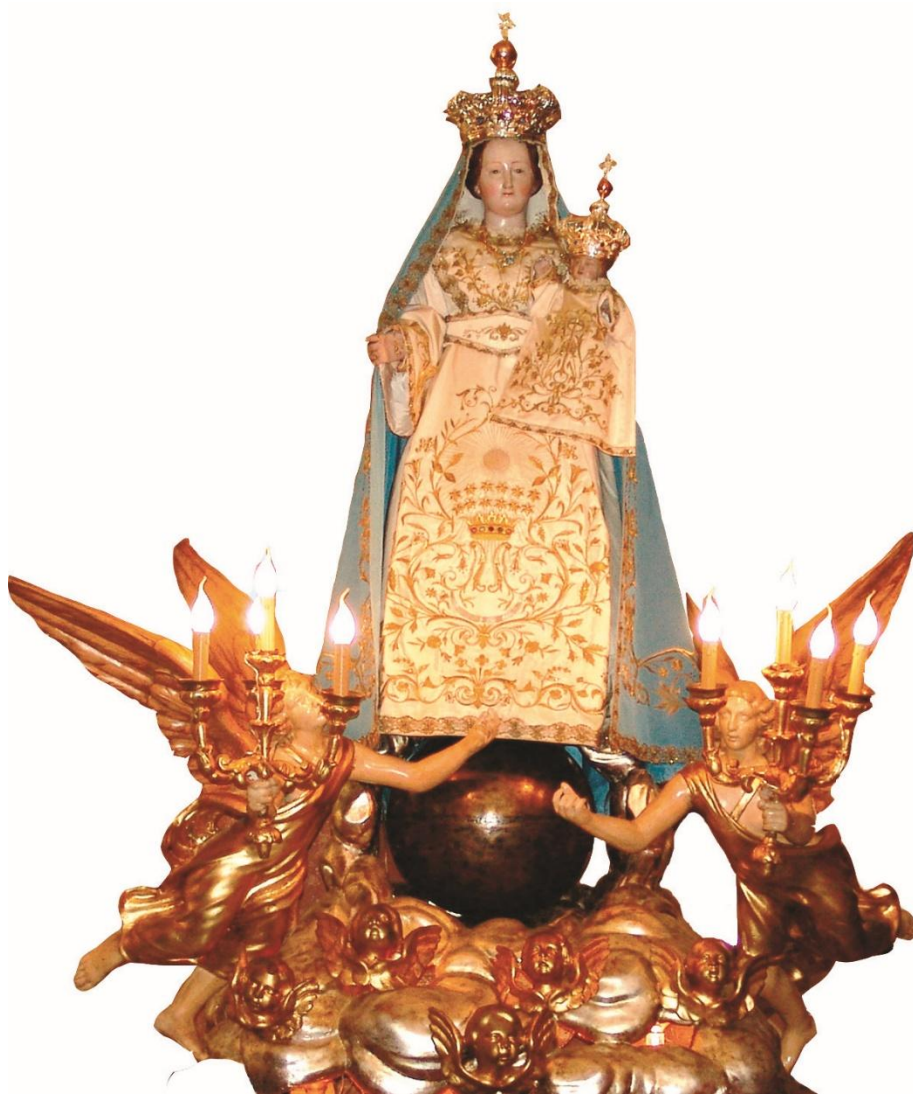
Fig.4 Settefrati – Chiesa Parrocchiale di S. Stefano Protomartire – Statua lignea della Madonna Bianca – Opera di Francesco Petronzio (1842).