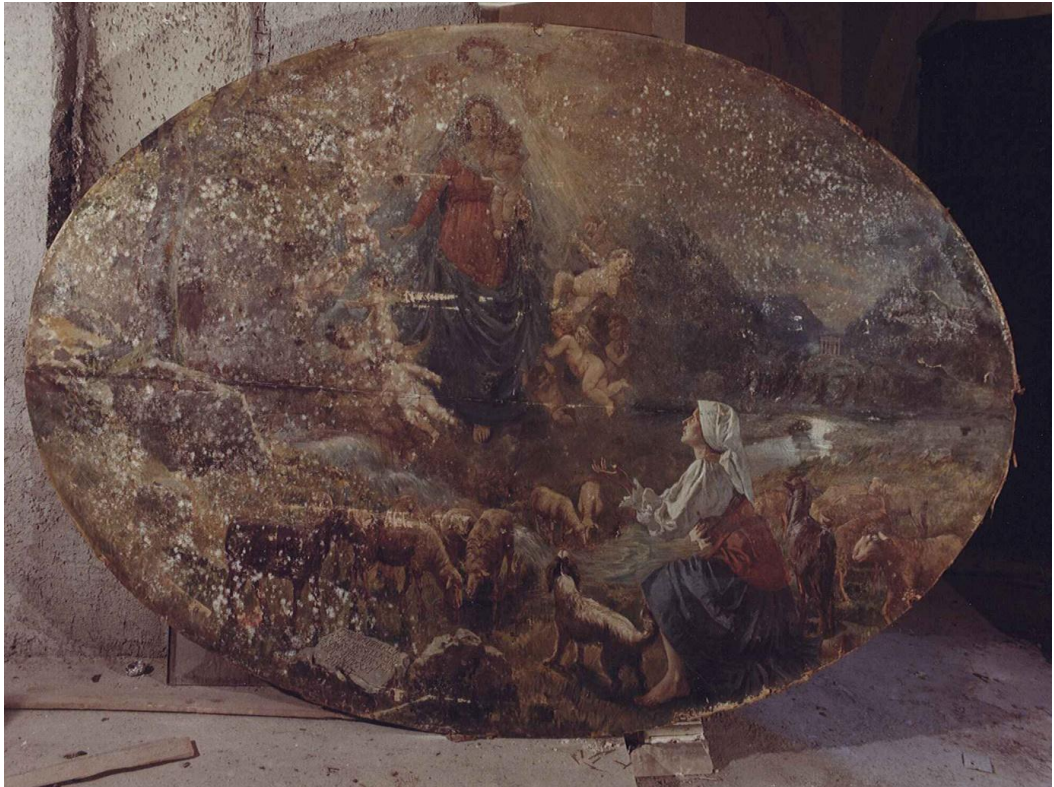
Fig.7. Settefrati – Chiesa Parrocchiale di S. Stefano Protomartire – Apparizione della Vergine alla pastorella Silvana : il dipinto come si presentava prima di essere restaurato e subito dopo trafugato. – Opera su tela di Angelo Cannone (1931).