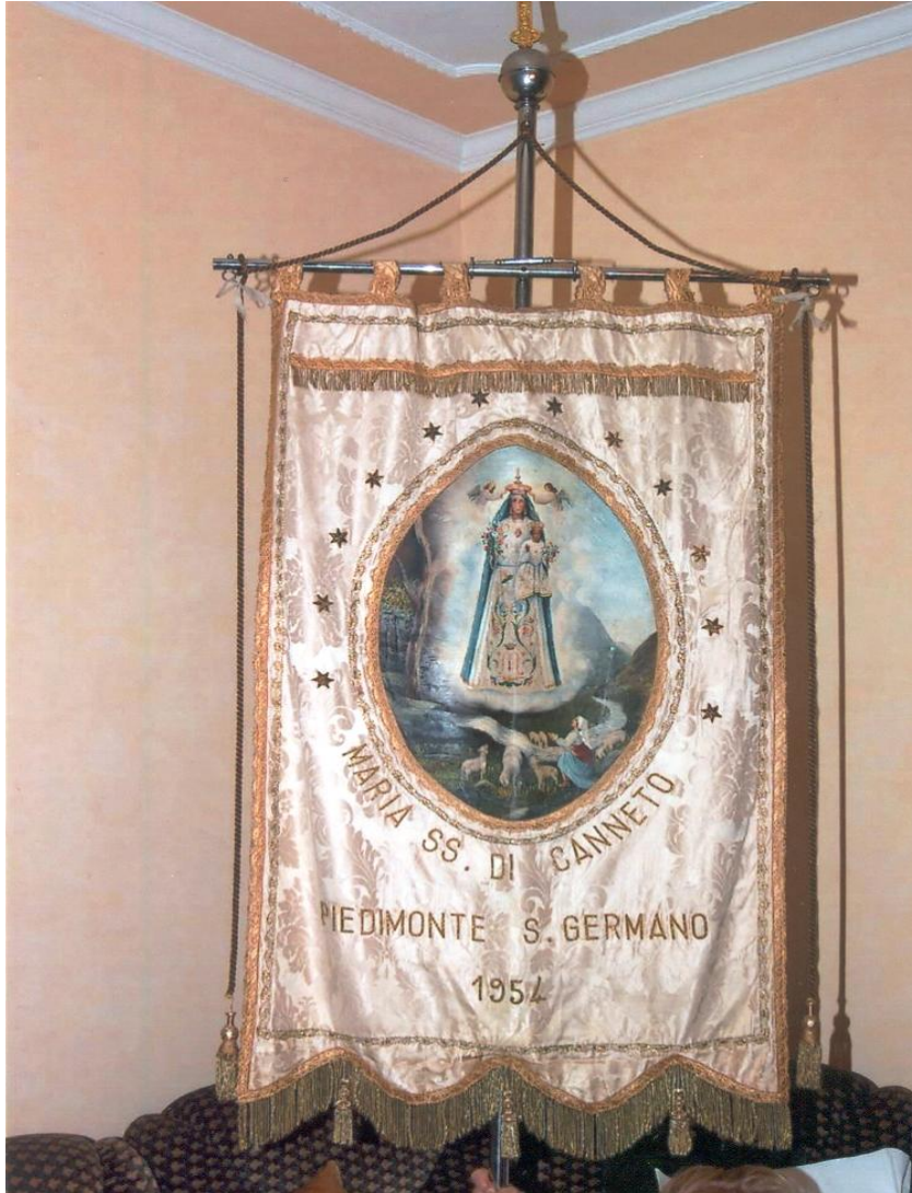
Fig.2 Piedimonte San Germano – Stendardo della Compagnia dei Pellegrini al Santuario di Maria SS.ma di Canneto (1954).