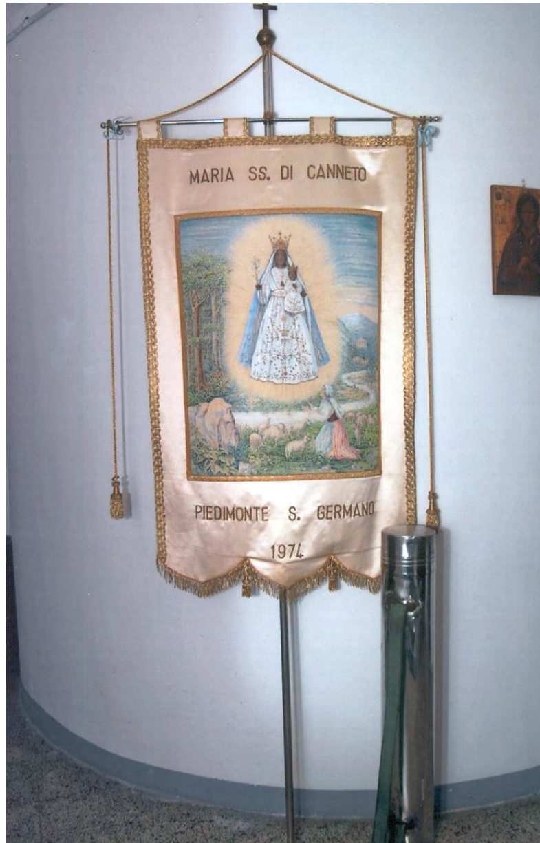
Fig.3 Piedimonte San Germano – Stendardo della Compagnia dei Pellegrini al Santuario di Maria SS.ma di Canneto (1974).