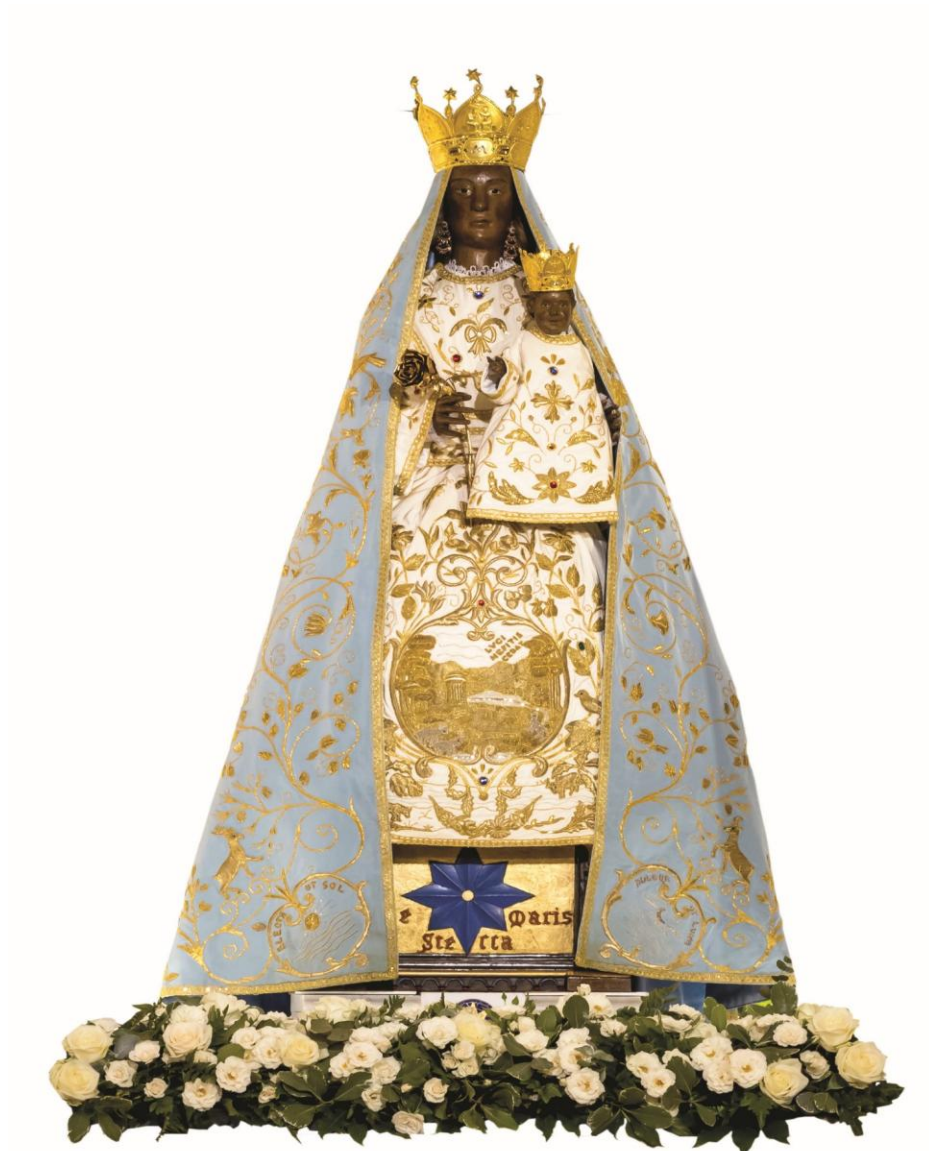
Fig.6 Santuario di Maria SS.ma di Canneto – Lato destro dell’altare maggiore – Statua lignea della Madonna Nera – Opera d’influenza benedettina, area abruzzese-molisana (XI-XIII sec.).