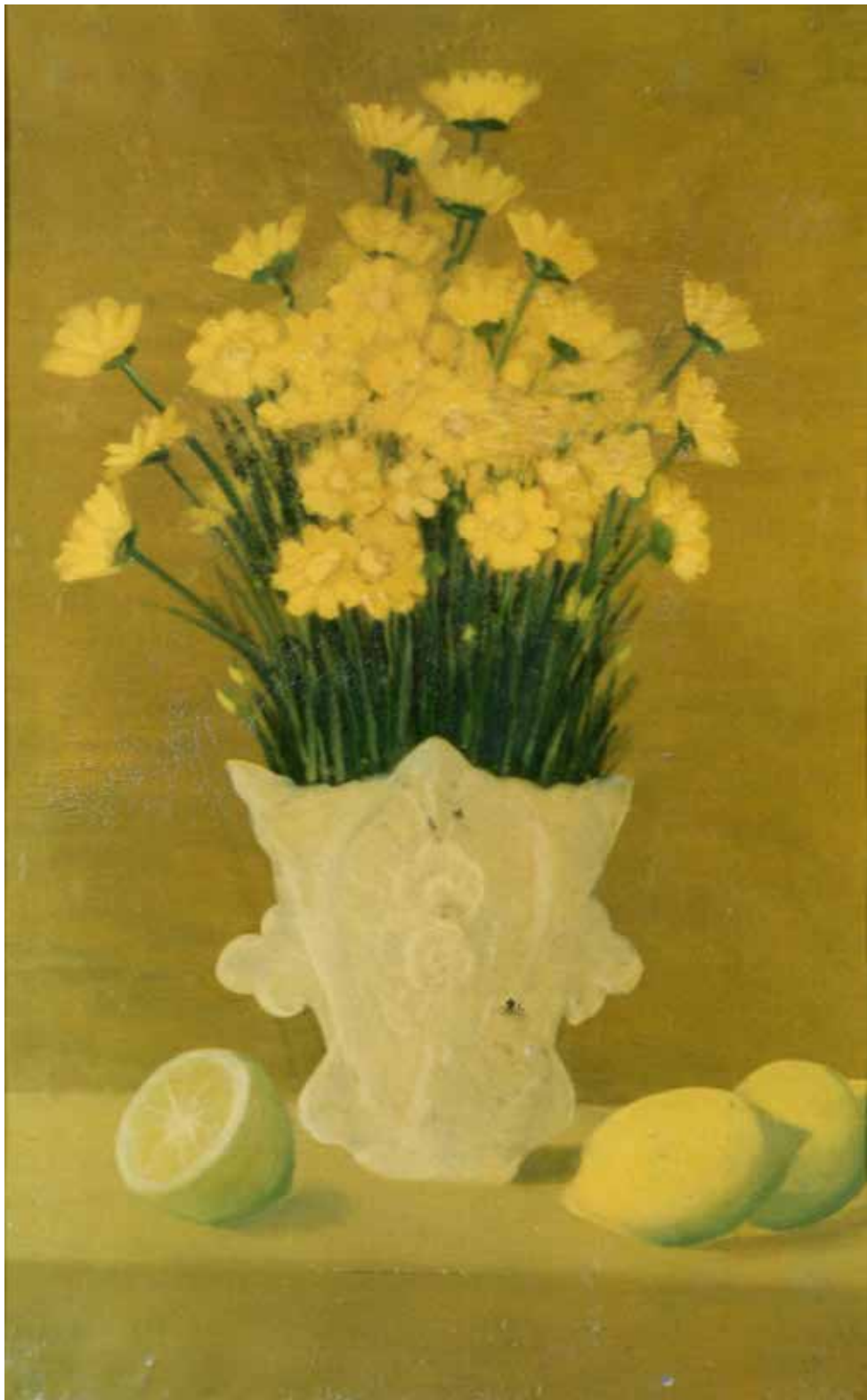
Fig. 44. Pippo Rizzo (Corleone 1897-Palermo 1964), Vaso con margherite e limoni , olio su tavola, cm 52,2x33, firmato in basso a destra: RIZZO.