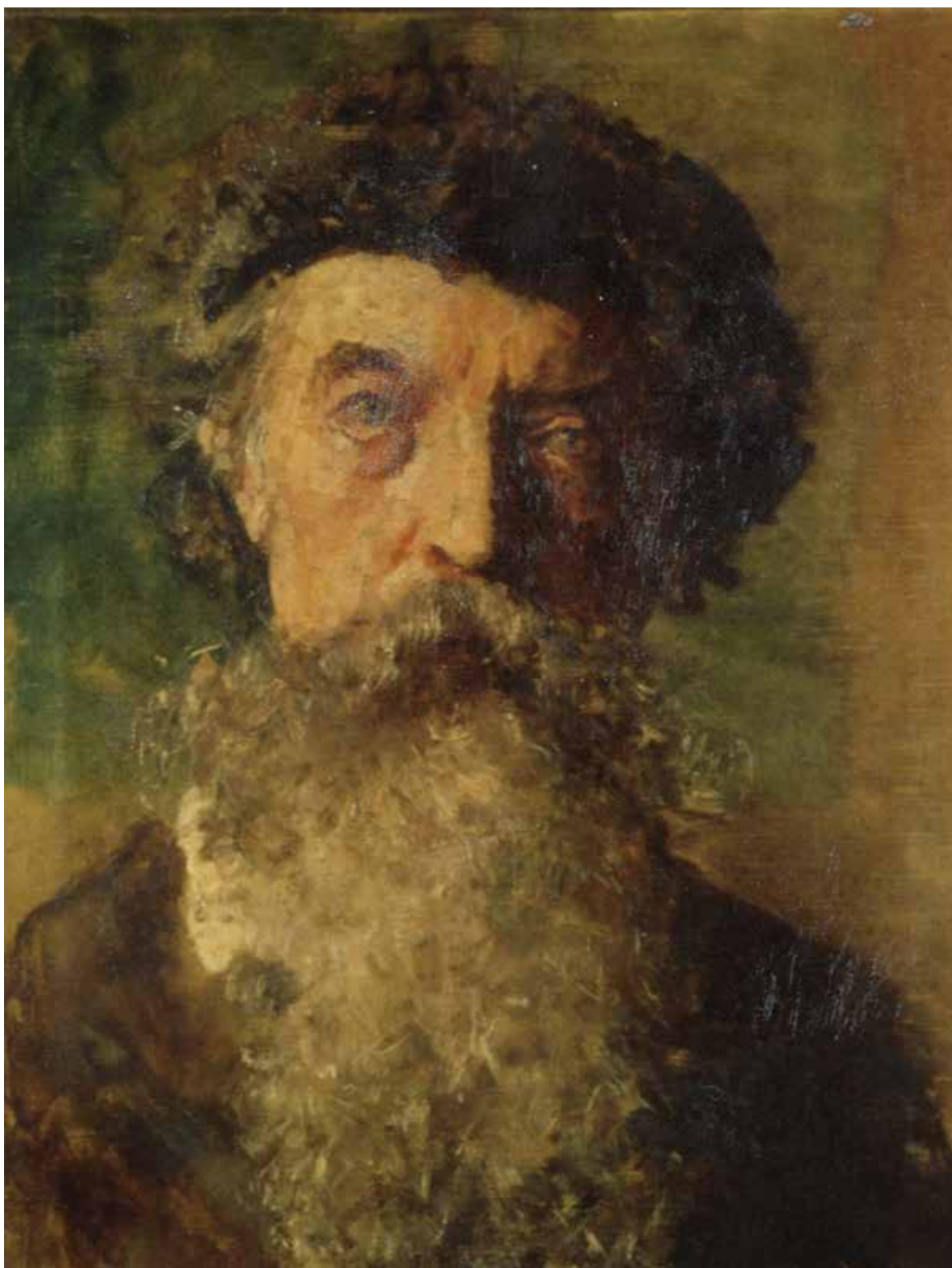
Fig. 2. Paolo Vetri (Enna 1855-Napoli 1937), attr., Ritratto del pittore Salvatore Lo Forte , olio su tela, cm 46x36,2.