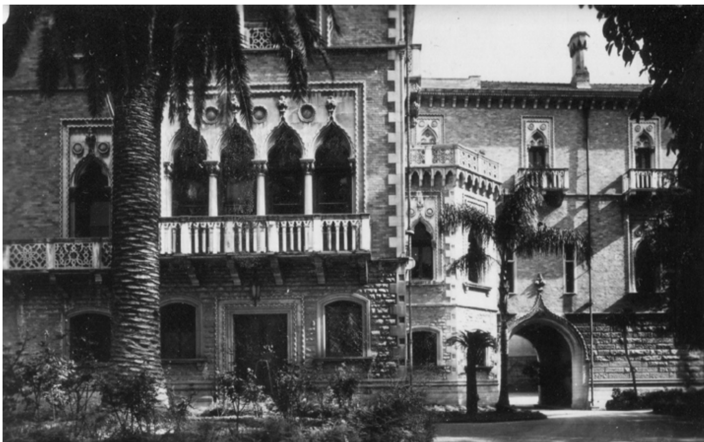
Fig. 54. Palermo, Villa Whitaker in via Cavour, sede del Circolo dal 1946 al 1972, Prospetto esterno , fotografia della prima metà del XX sec.

degli artisti, dei professionisti e degli amatori – gli unici che potevano assicurare «la continuità di istituzioni del genere» – fu raggiunto, considerate anche le numerose richieste di acquisti delle opere esposte 64 .