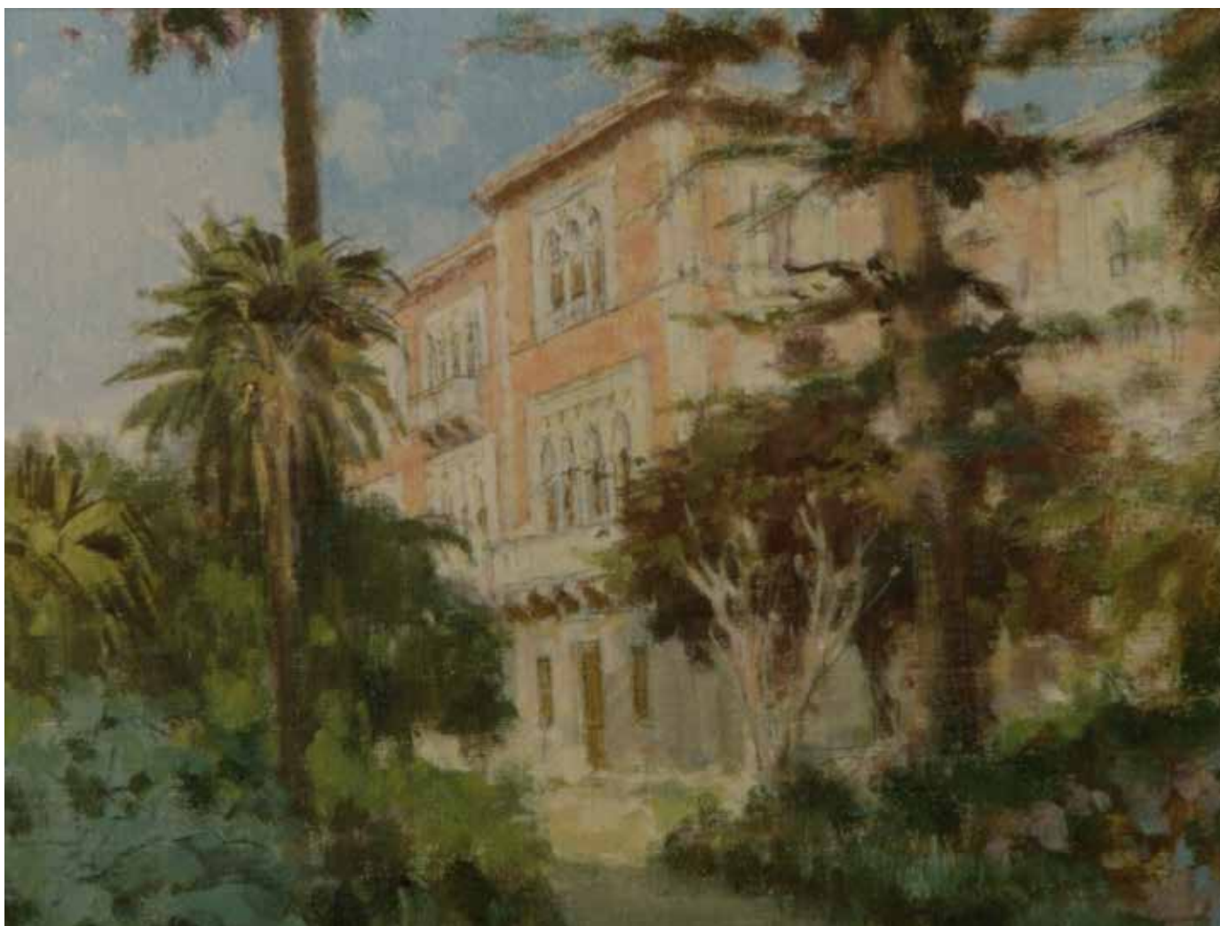
Fig. 57. Antonio Cutino (New York 1905-Palermo 1984), Veduta di Villa Whitaker in via Cavour , 1950, olio su tela, cm 19x24, in basso a sinistra: A. Cutino.

voleva «richiamare e polarizzare su di sé l'attenzione e l'interesse costante del mondo elegante e degli amatori delle cose dell'arte» 82 . Tuttavia molte di queste iniziative non riuscirono a concretizzarsi e rimasero solo proposte annotate nei verbali delle sedute dell'epoca.