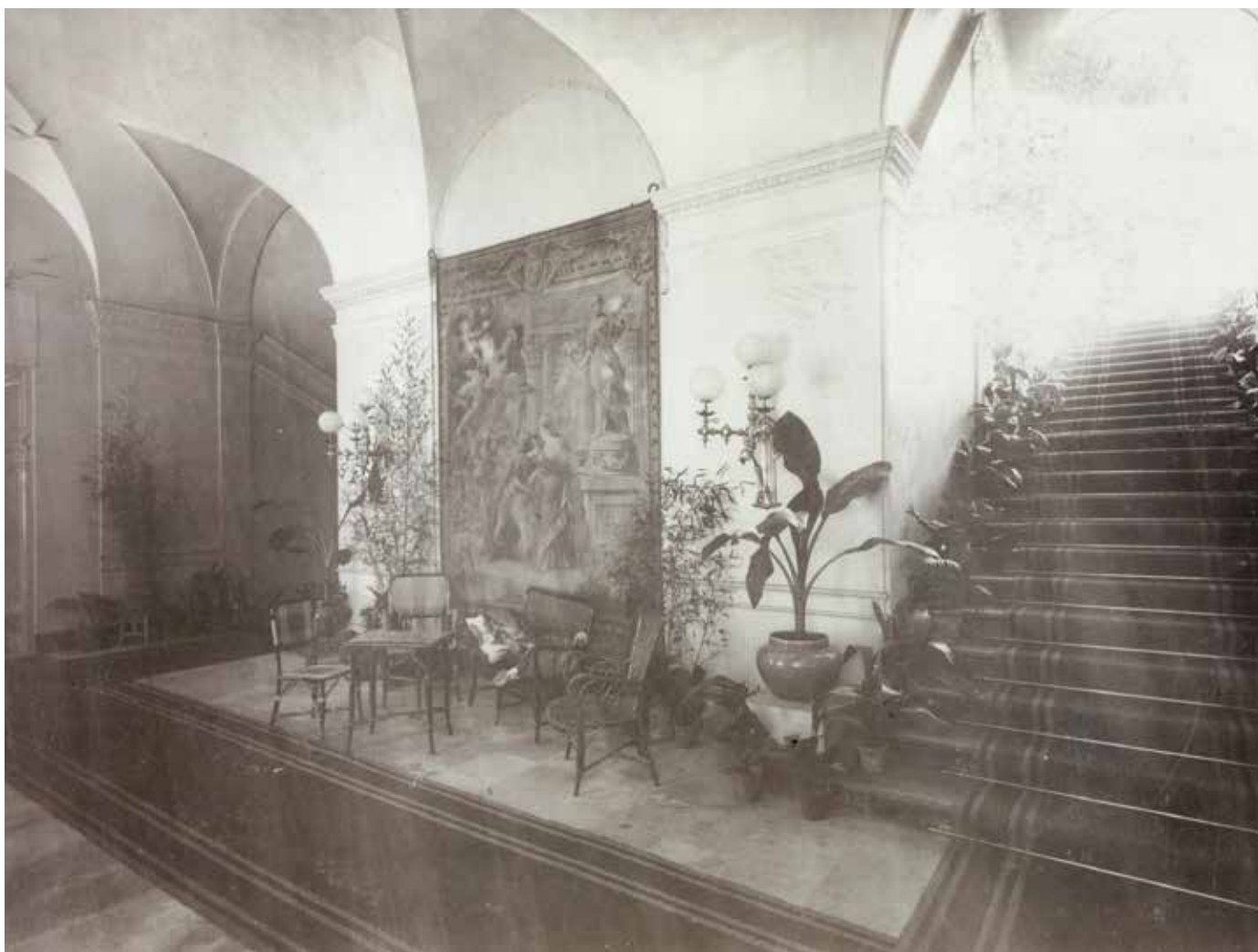
Fig. 9. Palermo, Palazzo Larderìa-Ganci, Scalone , fotografia della fine del XIX sec.