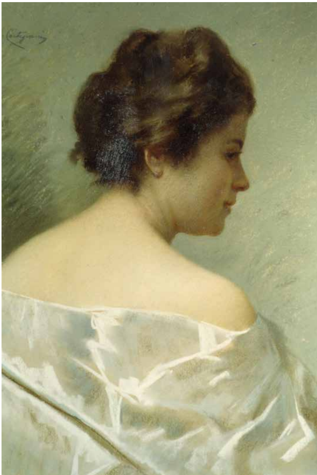
Fig. 20. Michele Cortegiani (Palermo 1857-Tunisi 1919), Ritratto di donna , pastello e tempera su carta, cm 68x50, firmato in alto a sinistra: M. Cortegiani .