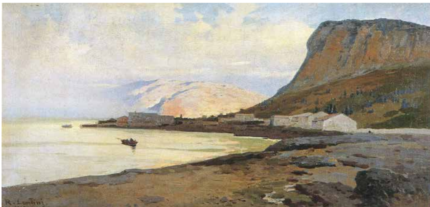
Fig. 37. Rocco Lentini (Palermo 1858-Venezia 1943), Tramonto a Sferracavallo , 1910, olio su tela, cm 65x120, firmato e datato in basso a sinistra: R. Lentini 1910.

le due forme: vorrei ricostituire, almeno parzialmente, l'antica unità della bellezza delle sue manifestazioni: ideali e pratiche. Nel Rinascimento, infatti, come in tutti i periodi di creazione veramente organica, l'arte pura e l'arte decorativa non vissero mai divise fra di loro, ma anzi si strinsero in felice connubio [...] alle solite Esposizioni – Belle, generiche e per così dire astratte – sostituirei degli ambienti impostati di signorile abitabilità. In altri termini ogni sala dovrebbe costituire una specie di sinfonia di forma e di colori ove opere d'arte (quadri, bronzi, targhette, acqueforti) troverebbero la loro sede naturale e appropriata. Restringerei l'esperimento alla sola Italia e distribuirei le sale secondo le regioni [...] ognuna dovrebbe simulare, quasi, una piccola e scelta galleria moderna appartenente ad un signore di buon gusto; ognuna dovrebbe avere un'impronta decorativa "nuova", ma, possibilmente, con manifesti richiami allo stile più caratteristico del luogo 28 .