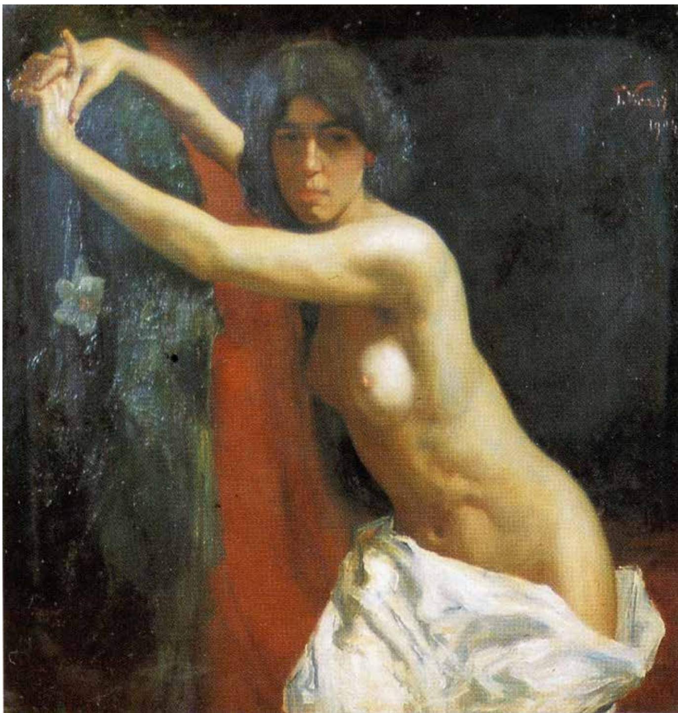
Fig. 34. Tommaso Vicari (Palermo, documentato nella seconda metà del XIX sec.), Pensiero che seduce , 1904, olio su tela, cm 95x106, firmato e datato in basso a destra: T. Vicari 904 .