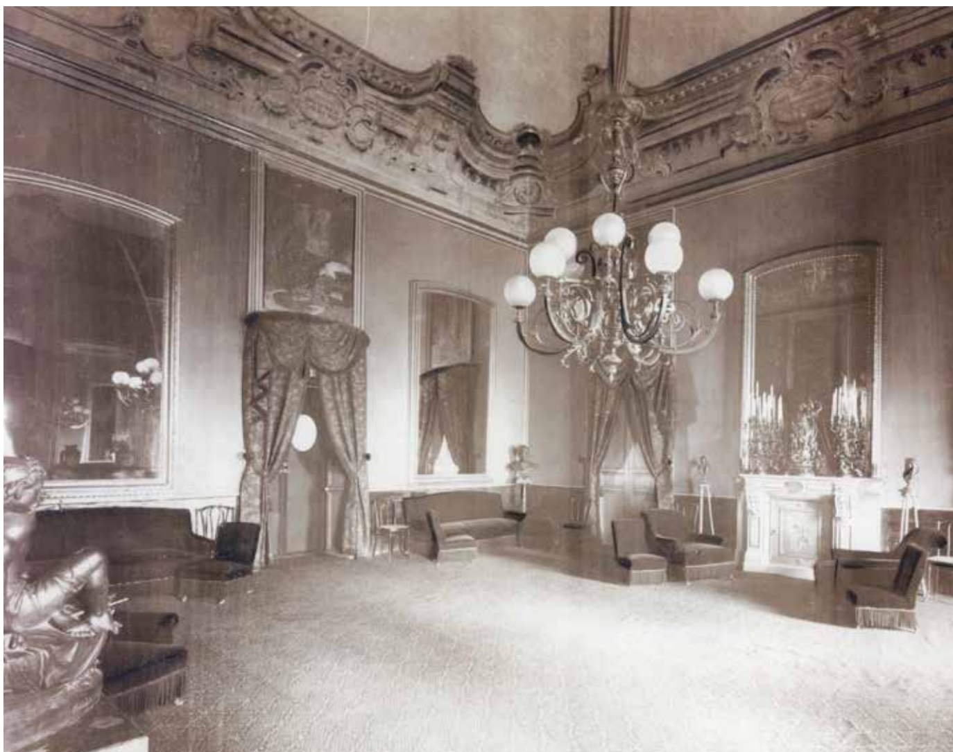
Fig. 11. Palermo, Palazzo Lardereria-Ganci, Salone , fotografia della fine del XIX sec.

nuale istituzione dello studio dal vero e del costume che si teneva in una apposita sala del Circolo (Fig. 13). Quest'ambiente era arredato con panche, cavalletti, lanterne e qualche mobile, come una grande poltrona di gusto orientaleggiante, sulla quale spesso sedevano le modelle. C'erano anche due sedie e una consolle in stile rococò, elementi che si ritrovano in numerosi studi di figura eseguiti proprio in quell'ambiente dai soci del Circolo. Basti menzionare il Pierrot dipinto ad acquarello da Salvatore Gregoriotti nel 1904, la Fanciulla allo specchio , gli studi di costume orientale e il Pierrot eseguiti, sempre ad acquarello, da Salvatore Marchesi (Figg. 14-17) 77 .