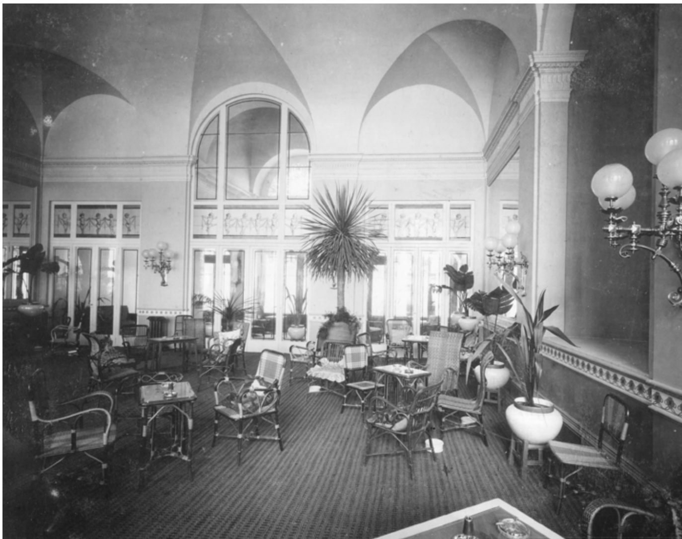
Fig. 10. Palermo, Palazzo Larderìa-Ganci, Salone , fotografia della fine del XIX sec.

Ponchielli, Strauss, Vagner (sic!), Meyerbeer – forma cornice alla bella composizione del centro. Nel grande Salone poi, è sulla volta di essa concentrato tutto il lavoro degli artisti. Lo sguardo si spazia in un vasto orizzonte in mezzo al quale volano amorini ed uccelli; ed i primi gettan fiori su quanti stan nella sala ad osservarli, ridendo fanciullescamente della loro biricchinata. Tutt'intorno una leggera balaustrata, dalla quale scendono fastosi arazzi dai smaglianti colori, circonda la base della volta. Sui pilastri della balaustrata grandeggiano vasi colmi di verdeggianti arbusti e spiccano in mezzo ad essi le agavi carnose e appuntite, le latomie a ventaglio del verde or pallido or robusto, il caladiane dalle larghe foglie variegiate, punteggiate, maculate, e le variopinte begonie, mentre ricche masse di variopinti si abbarbicano or qua or là, formano