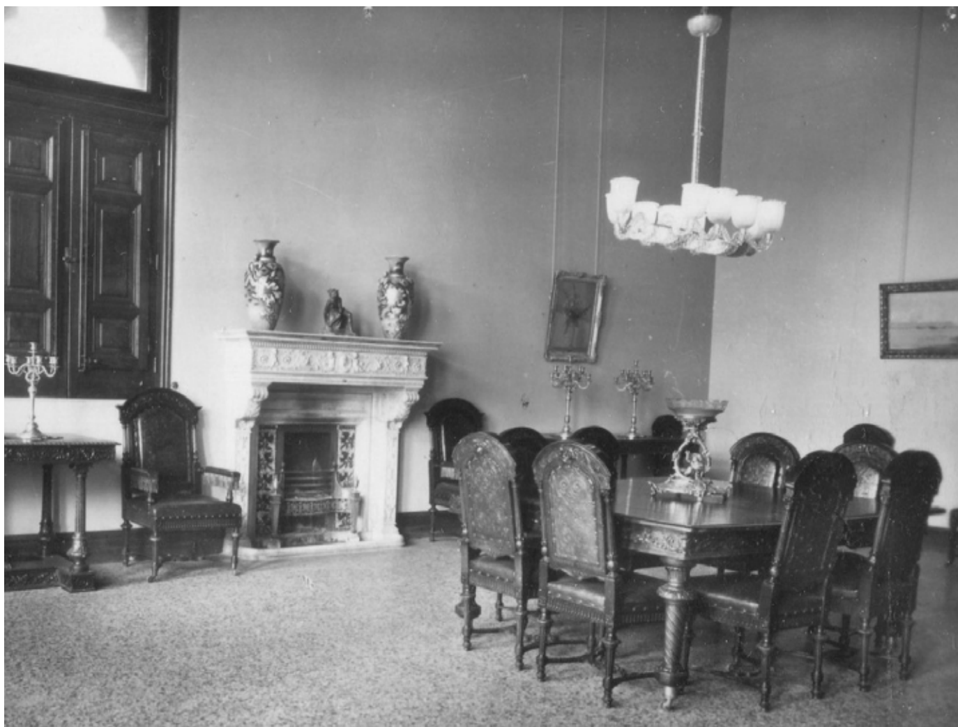
Fig. 56. Palermo, Villa Whitaker in via Cavour, Camera da pranzo , fotografia della prima metà del XX sec.

Tuttavia fu solo dopo il settembre del 1946 che il Circolo, rifondato con un nuovo statuto e regolamento, stampato nel 1951, poté riprendere in pieno la sua attività, stabilendo la propria sede nella splendida e prestigiosa Villa Whitaker, in via Cavour 79 (Figg. 54-57). L'edificio, caratterizzato da una originale architettura in neogotico veneziano, dovette essere risistemato dopo i danni provocati dalla seconda guerra mondiale. Anche il mobilio del Circolo, che era andato disperso durante i vari spostamenti da una sede all'altra, dovette essere in gran parte riacquistato.