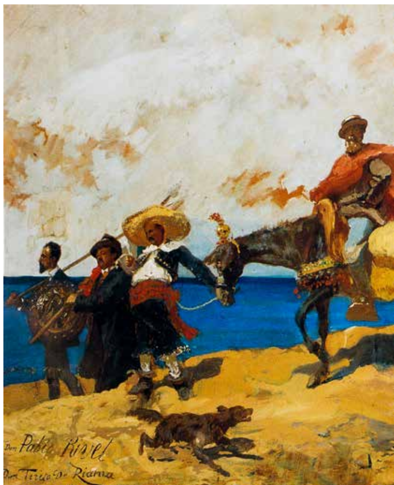
Fig. 12. Paolo Vetri (Enna 1855-Napoli 1937), Ettore De Maria Bergler (Napoli 1850-Palermo 1938), Una carovana di artisti nel deserto di... , 1889, tempera su carta, cm 123x300, firmato e datato: Don Pablo Rivet Don Tereto de Riama 1889 .