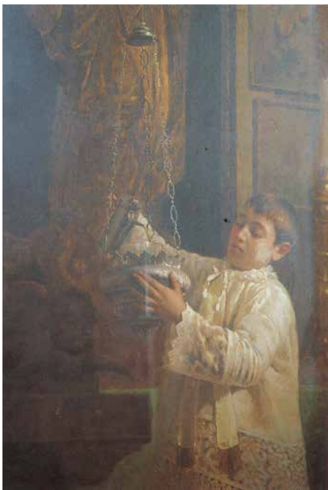
Fig. 26. Michele Cortegiani (Palermo 1857-Tunisi 1919), Chie-richetto (particolare), 1894, olio su tela, cm 230x101,5, firmato e datato in basso a sinistra: M. Cortegiani 94.

buona, specialmente fra i Lombardi», e la carenza di idee «mentre il mondo che li attornia è agitato da tante idee nuove, da tanti fatti che, essi soli, sono quadri imponenti» 49 . Notò anche la penuria di artisti rinomati come Domenico Morelli, Filippo Palizzi, Francesco Paolo Michetti, mentre evidenziò la presenza dei pittori siciliani «che si sono meglio rivelati a questa mostra. Il Cortegiani per la figura e il Lojacono per il paesaggio. Essi, come gli altri pittori dell'Isola, sentono fortemente il colore» 50 .