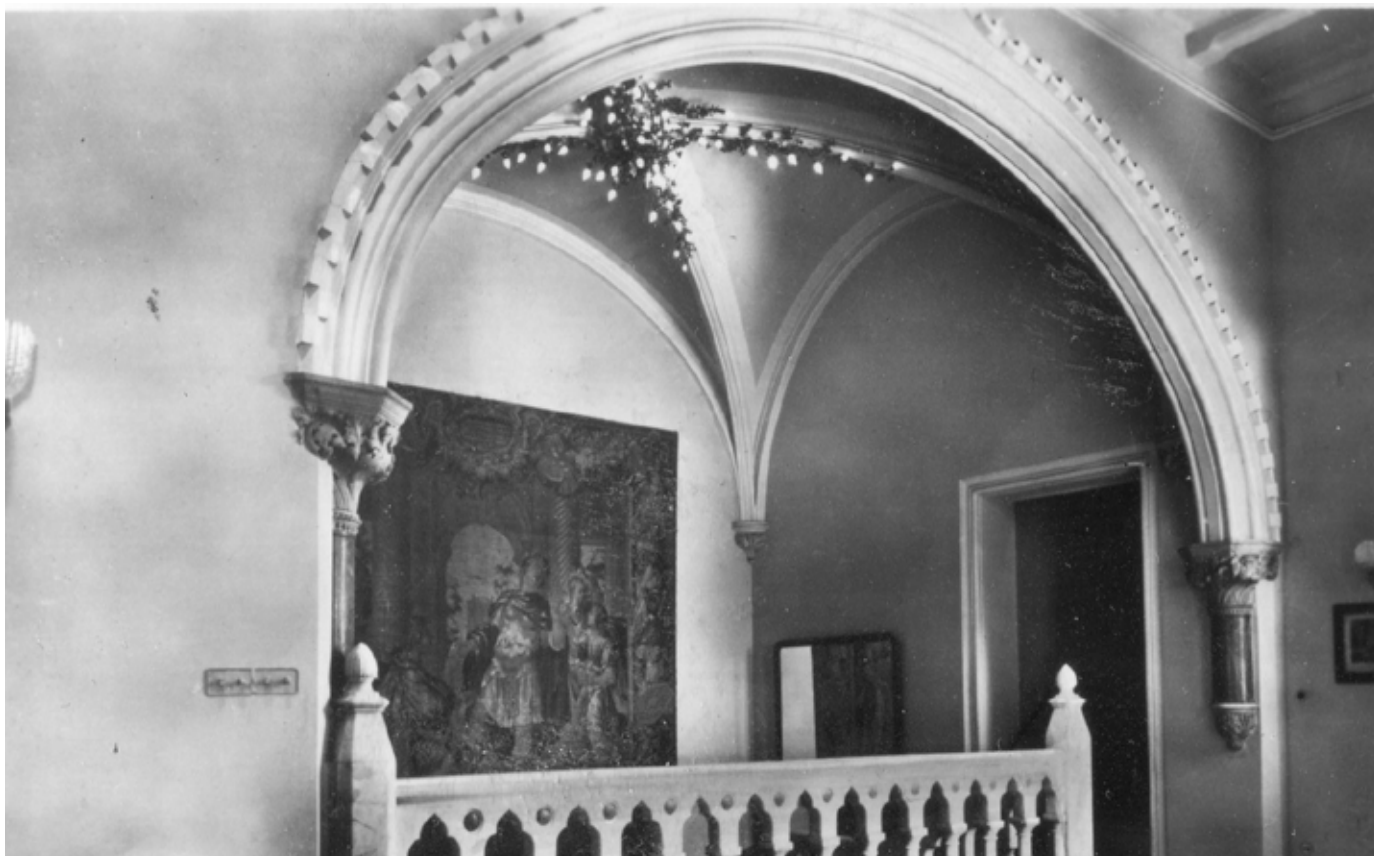
Fig. 55. Palermo, Villa Whitaker in via Cavour, Scalone , fotografia della prima metà del XX sec.

stica, organizzata da un comitato presieduto dal senatore Giovanni Gentile 71 . La rassegna raccoglieva per la prima volta tutte le opere più rappresentative dell'artista siciliano, che era stato scoperto giovanissimo proprio in occasione delle prime mostre della Società Promotrice curate dal Circolo Artistico 72 .