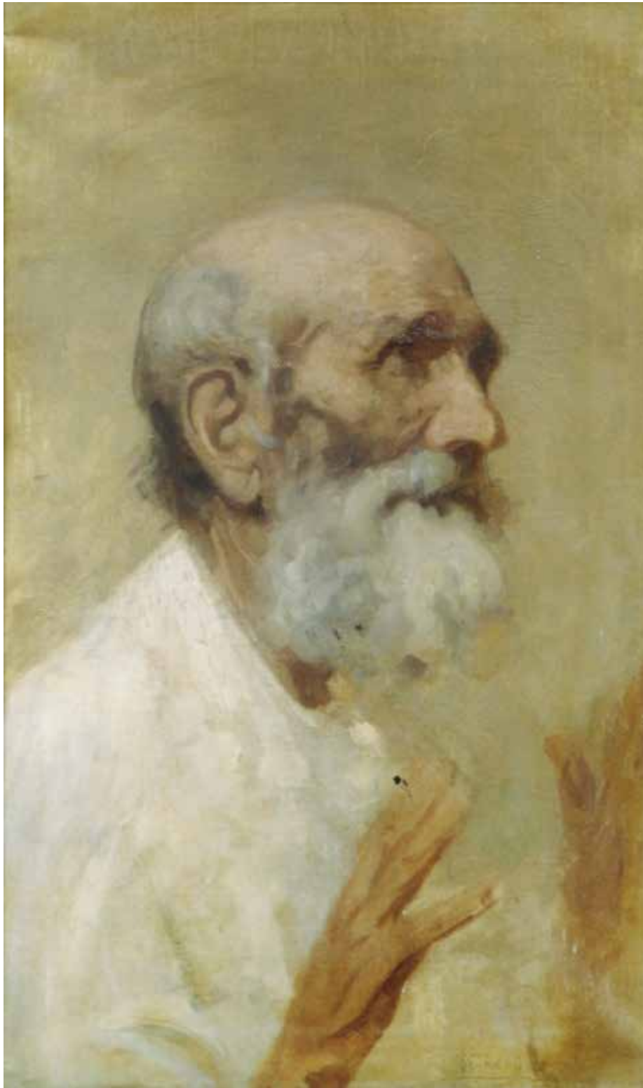
Fig. 36. Pietro De Francisco (Palermo 1873-Mentone 1969), Testa di vecchio , olio su tela, cm 51,5x31, in basso a destra: De Francisco .