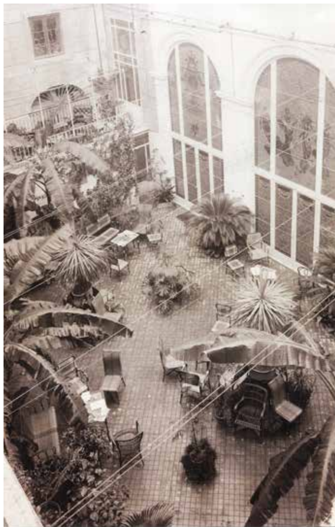
Fig. 8. Palermo, Palazzo Lardereria-Ganci, Giardino d'inverno , fotografia della fine del XIX sec.

Merita speciale ricordo l'incremento e sviluppo di questo Circolo Artistico, che, sorto con modestissimi auspici, già comincia a diventare imponente, e pel numero considerevole dei soci, e per le belle iniziative di cui si fa promotore. Di tanto sia lode precipua all'abilità e solerzia dell'uomo egregio che lo presiede, commendatore Basile, direttore di questa regia scuola d'applicazione, il quale ha saputo assicurarsi l'aiuto di tutti i soci, che fanno a gara per rendere tale istituzione degna davvero della grande città in cui risiede 68 .