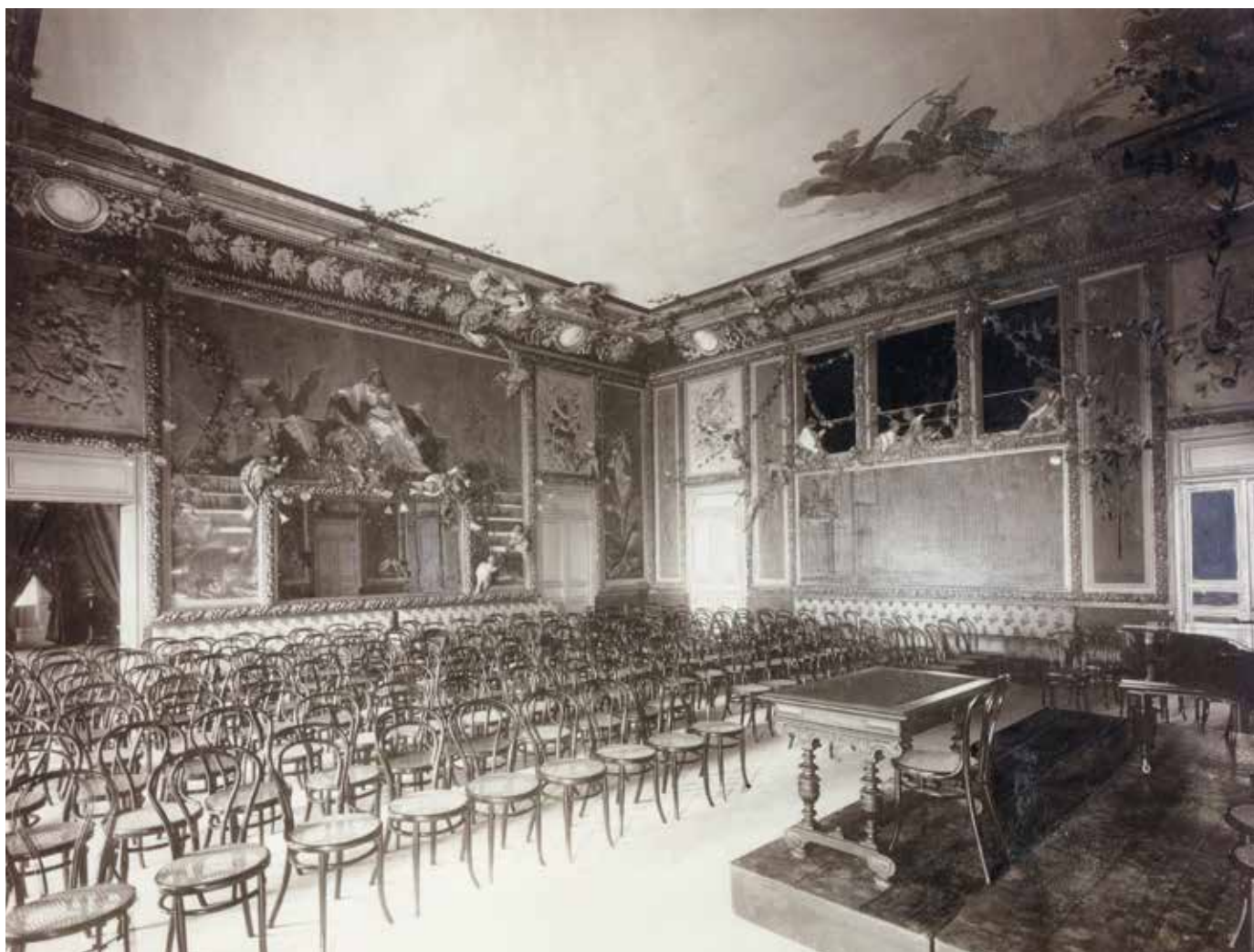
Fig. 28. Palazzo Larderìa-Ganci di Palermo, Salone delle feste , decorazione pittoriche della volta: Francesco Padovano, Niccolò Giannone, Gaetano Musso; delle pareti: Giuseppe Sciuti, calchi in gesso da opere di Giacomo Serpotta, fotografia della fine del XIX sec.

tezza nel recepire i crismi di quel nuovo gusto che in seguito avrebbero contribuito a promuovere 85 .