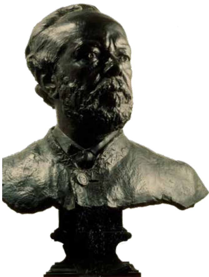
Fig. 24. Achille D'Orsi (Napoli 1845-1929), Ritratto del pittore Filippo Palizzi , 1895, bronzo, cm 62 (altezza), firmato sul retro: A. D'Orsi Fonderia Bracale Napoli , inciso sulla base: Questo bronzo effigie dell'Insigne maestro Filippo Palizzi è stato allegato con alcuni tubi di colori che servirono alla gloriosa produzione del grande Artista , sul cartiglio: Al Circolo Artistico della Illustrate Città di Palermo Achille d'Orsi grato Napoli 1895 .

Nazionale del 1891 che, iniziati già nel 1888, ebbero riflessi notevoli sull'attività del Circolo Artistico.