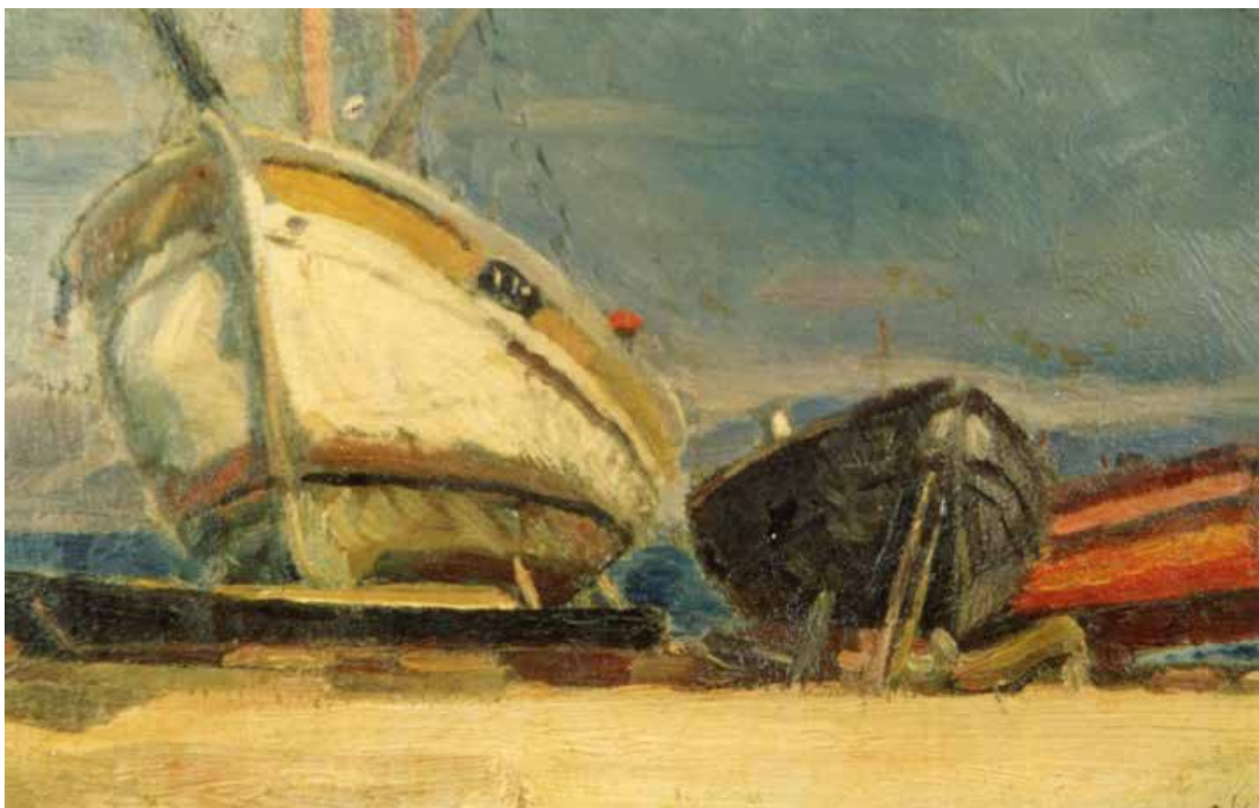
Fig. 53. Daniele Schmiedt (Palermo 1888-Messina 1954), Barche in cantiere , 1946, olio su tavola, cm 20x31,5, firmato e datato in basso a destra: D. Schmiedt 46.

Volpes, Camarda e Mirabella 60 . A questa rassegna, che riscosse notevole successo e interessanti profitti con la vendita di numerosi ventagli, seguirono le mostre Pro Patria Ars del 1916, del 1917 e del 1918 associate a vari spettacoli di beneficenza 61 . A carattere nazionale, queste esposizioni furono promosse da un comitato esecutivo, composto da uomini d'affari e intellettuali tra i quali lo stesso Francesco Colnago, Giuseppe Ardizzone – azionista e direttore del “Giornale di Sicilia” – e Vittorio Ducrot, a capo dell’omonimo mobilificio palermitano. Le esposizioni Pro Patria Ars si tennero nei locali del Kursaal Biondo di Palermo, progettato da Ernesto Basile nel 1913, e avrebbero dovuto incarnare le aspirazioni del suo ordinatore: