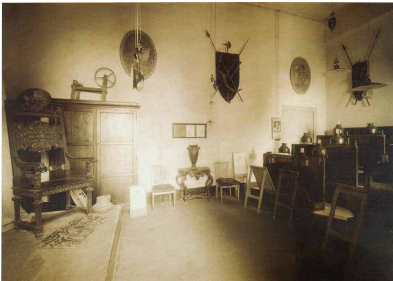
Fig. 13. Palermo, Palazzo Larderia-Gangi, Aula per lo studio dal vero , fotografia della fine del XIX sec.

L'altro aspetto che non fu mai trascurato fu quello ludico, dovendo il Circolo assolvere anche alla funzione di «geniale ritrovo per quanti si dedicavano per professione o per diletto all'arte» 80 . Per questo motivo, oltre alla sala di lettura, vennero creati spazi adibiti al gioco e alla conversazione e, molto spesso, il grande salone centrale fu utilizzato per ospitare concerti organizzati dal Collegio d'arte dei musicisti. Ogni anno inoltre il Circolo era attivamente impegnato nella preparazione delle feste per il carnevale che, come annunciava prima del loro inizio il "Giornale di Sicilia", comprendevano «balli pubblici, festivals popolari, corsi di fiori, carrozzate e... altre sorprese non meno dilettevoli e gradite» 81 .