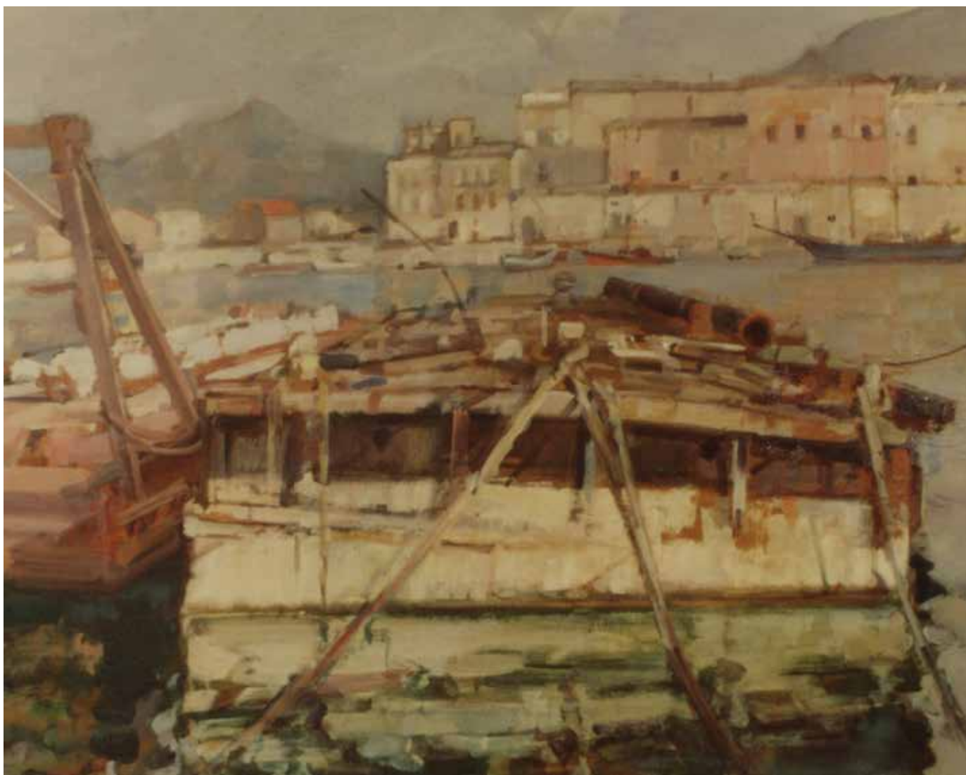
Fig. 48. Salvatore Antonio Guarino (Sambuca di Sicilia, Agrigento-1882 Roma 1969), Riflessi d'acqua alla Cala di Palermo , 1929, olio su tela, cm 89x98, firmato in basso a destra: Guarino .

Nel frattempo, ad una presenza sempre più massiccia, tra i soci del Circolo, di rappresentanti delle antiche famiglie nobiliari – tra i quali si segnalano il conte Romualdo Trigona dei principi di S. Elia, allora sindaco di Palermo, il principe Pietro di Scalea, il conte Giuseppe Lanza di Mazzarino – corrispose un forte accentuarsi dell'attenzione verso gli aspetti ludici e ricreativi del programma delle loro iniziative 49 . Si susseguirono infatti proposte mondane di vario genere, dai «corsi dei fiori» alle «primavere siciliane» ai tableaux vivants 50 . Si organizzarono nelle stesse sale del Circolo feste da ballo, ricchi banchetti, concerti, ai quali intervenivano