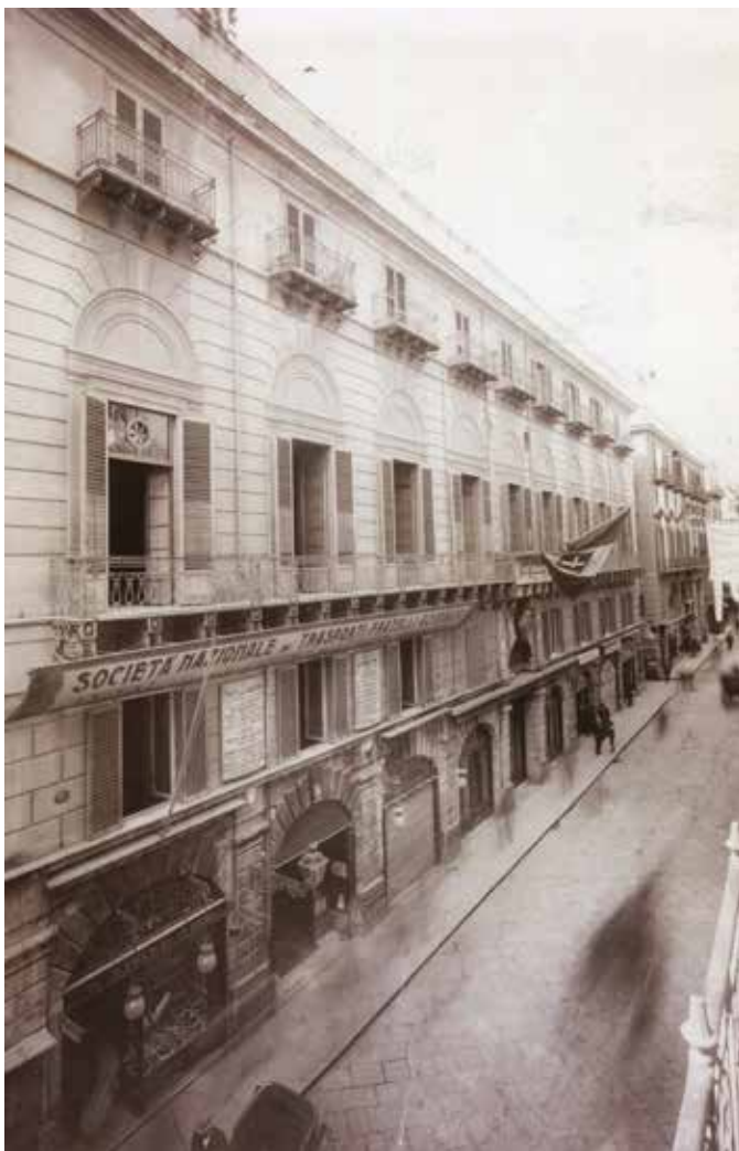
Fig. 7. Palermo, Palazzo Lardereria-Ganci, sede del Circolo Artistico dal 1885 al 1921, Prospetto su Corso Vittorio Emanuele , fotografia della fine del XIX sec.

gliorare le condizioni della sede 67 , dall'altro ad organizzare esposizioni artistiche e manifestazioni di vario genere, destinate ad attirare l'attenzione della critica sulla giovane associazione.