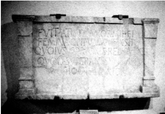
Fig. 3: CIL I 2 , 1206 ( Auctarium 306) = VI, 1958 = ILLRP , 805a.

del supporto, raffigurante un panier (si nota qui in particolare la ridondanza retorica di quod superant dopo reliquiae ).