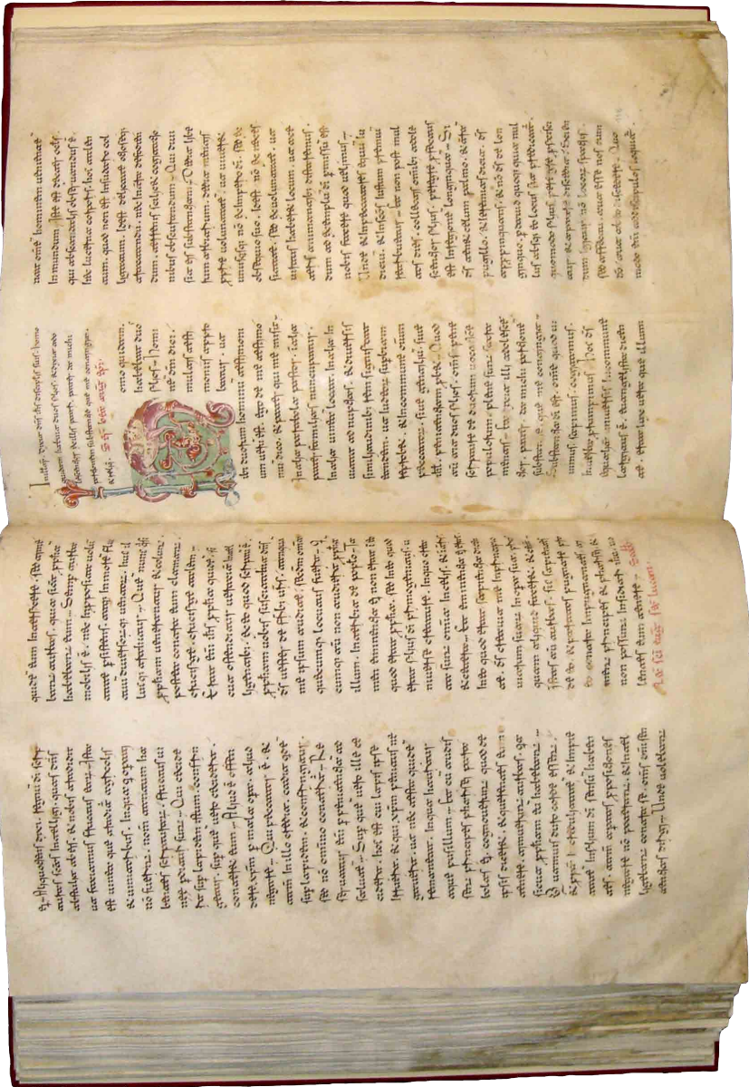
Salerno, Museo Diocesano "San Matteo" s.n., cc. 117v-118r (Hieronymus, Epist. 21). Scheda 22