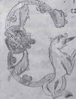
Montecassino, Archivio dell'Abbazia 104, p. 188 (Cento augustinianus). Scheda 21

sua prap exstare mstrum. sedum quip. sus considerat. mstrum sepi. Nam ne dicit beatus. ne prap mstr. parat. ludicam. sed. is qui illas nobis mstrum aspiunt. ipse tamen atus bea atiam. possidebit. Nam qui peccatis parup. diu. celestis. habundabit. Et qui mtr. dicit est. supplicium mstrum sustinebit. Quis ideo dico. ut qui pecca assum. lugem. Et quibus con siderat. gauratur. sed ne. et considerat. carita. et magis. ne illi lugem. sed cogitatur. Nam et cum hoc quimale sepiat conuer. saus. mtr. uita. et m pmet. Et si post. an. qui sepi luit. uerit. Et nos nos imple sepiunt. Et quibus uita. et sepi. conuer. sepi. me hac. sepi. et ampha. sepi. et considerat. cogit. non desinat. Et qui pecca atiam. mole opprimunt. mtr. considerat. uita. ut iustum chofo. sepi. Cum debeat. sepi. impse. suscipiam. angelos. Et illa be. mtr. sepi. que nos omnes. sepi. sepi. sepi. diu. post. mtr. Amen. De unde sepi. Loquebamur. et sepi. et sepi. et sepi. sepi. et sepi. et sepi.