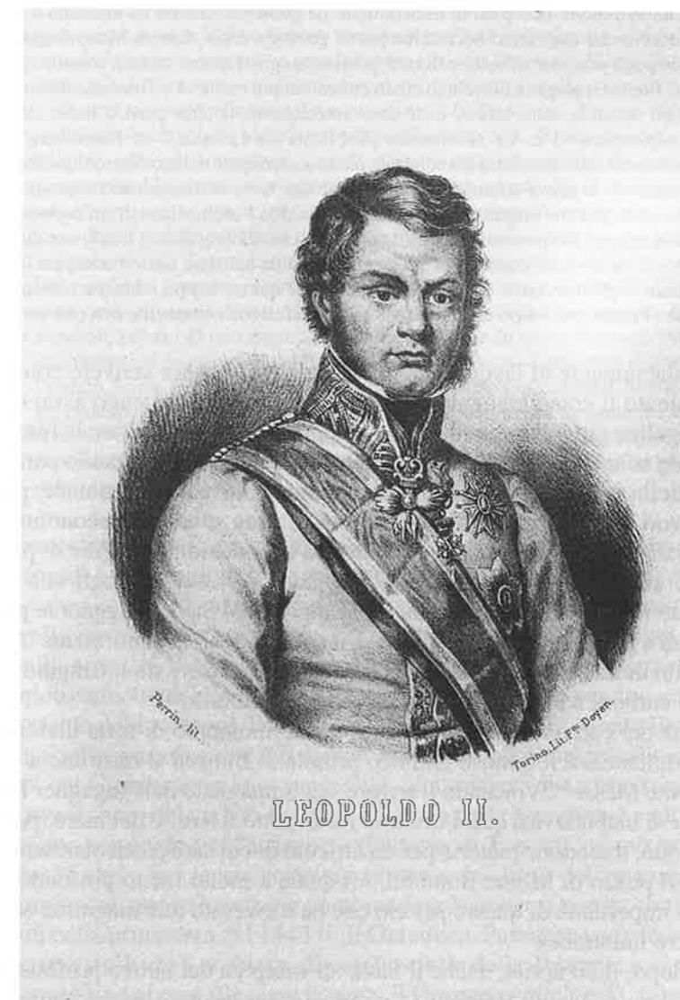
59. Ritratto di Leopoldo II d'Asburgo Lorena (litografia Perrini-Doyen), Pisa, Bibl. Univ.

Su questo documento, in un articolo per altro riccamente documentato, Felice Ippolito fondava la tesi di un attivo coinvolgimento del Savi nella chiamata di Pilla. In attesa di ulteriori approfondimenti, ci limitiamo a ricordare che la già citata lettera di risposta del pisano, datata 19 marzo 1842, è improntata ad un tono di notevole riservatezza che contrasta con la calorosa apertura scientifica ed umana del napoletano. Come abbiamo già indicato, Savi declinava l'invito ad essere il «duce» del nuovo collega, facendo riferimento al proprio stato di salute; a proposito della chiamata, lungi dall'esprimere una qualsivoglia valutazione o schernirsi cortesemente per il proprio coinvolgimento, si limitava a dire che, essendogli stato chiesto di scegliere, aveva optato per la Zoologia. Le lodi rituali del Pilla non venivano in alcun modo contraccambiate. Anzi, dopo aver confuso Piria con Pilla, affermando di essersi fatta una buona opinione del Pilla (cioè del Piria, come il destinatario annota al margine della missiva) che aveva incontrato pochi giorni prima, Savi lamentava (sia pure gentilmente) il fatto che il collega non fosse ancora in sede. Passava poi a descrivere in tono quasi burocratico le dotazioni scientifiche e le strutture dedicate alle discipline ora affidate al nuovo arrivato: