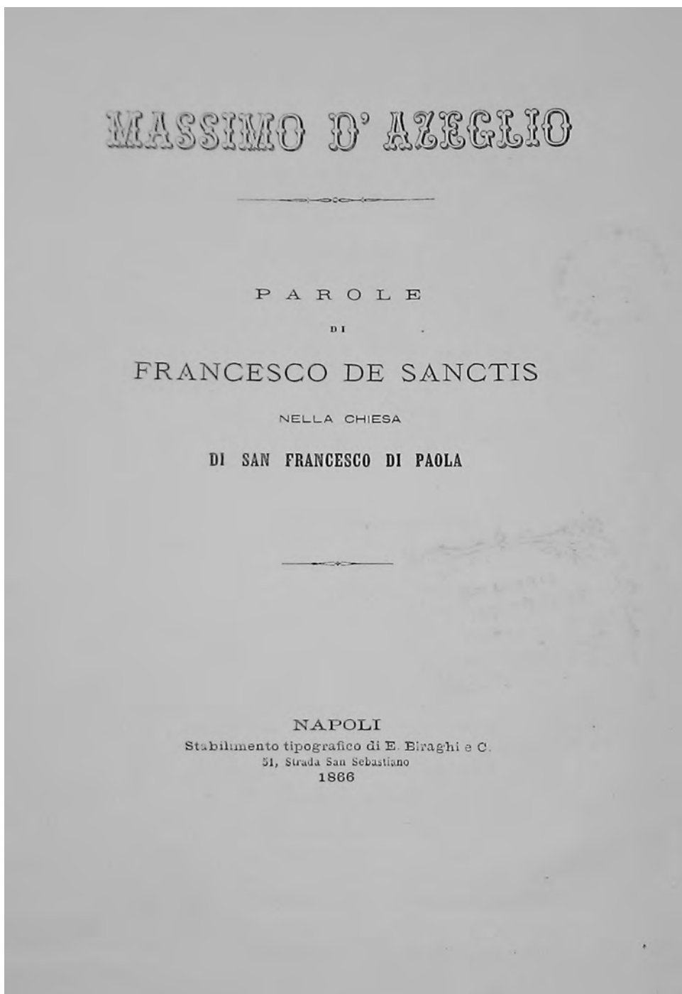
FIG. 1. Esemplare dell'opuscolo commemorativo del 1866 conservato nella Raccolta Desanctisiana della Biblioteca provinciale di Avellino.