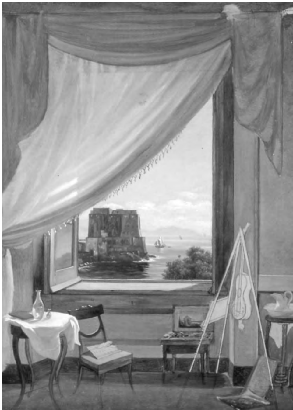
FIG. 2. MASSIMO D'AZEGLIO, Lo studio del pittore a Napoli , 1827, olio su tela 46,5 × 35,5, Torino, Fondazione Torino Musei-Galleria Civica d'Arte Moderna e Contemporanea.