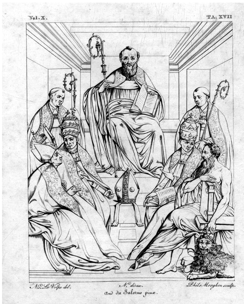
Fig. 1 – Andrea Sabatini da Salerno, San Nicola di Bari (in PISTOLESI 1825, tav. XXXIV)