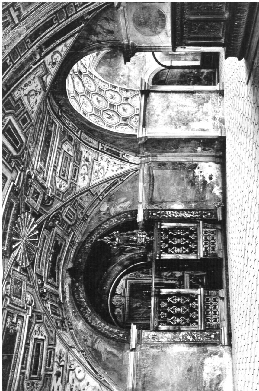
Fig. 3 – Marco Pino da Siena, Decorazione ad affresco, Abbazia benedettina di Montecassino, cripta