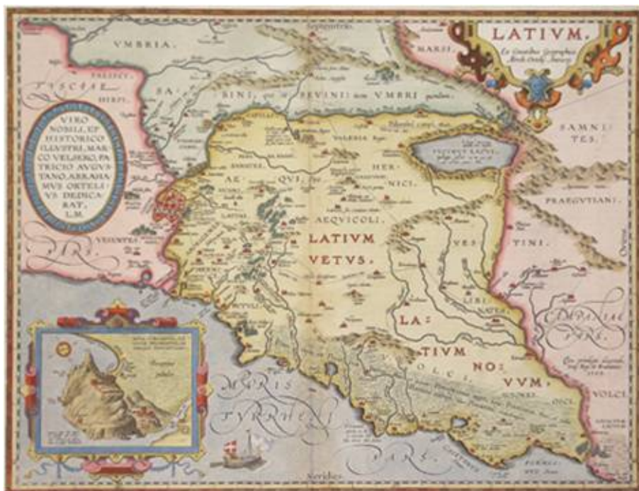
Figura 1. Ortelij Abraham, LATIUM Ex Conatibus Geographicis Abrah. Ortelij Antverp , 1595.

L'attuale provincia di Frosinone era inglobata in una prima grande macro regione istituita dall'imperatore Augusto dove sia il Latium vetus che quello novum o adiectum vengono uniti alla Campania formando un'unica regione nota come Regio I . A tal riguardo si confrontino le carte dell'Ortelio 3 (Fig. 1) e di Frederic Charles Louis Sickler 4 .