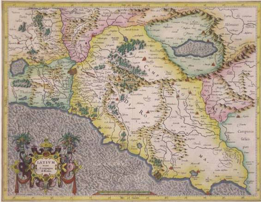
Figura 2. Gerhard Kremer, LATIUM nunc Campagna di Roma , 1595.

lementi antropici e geomorfologici. Questi ultimi, rappresentati secondo le tecniche che il tempo consentiva, mostrano le tessere di un mosaico complesso, definite dalle aste fluviali e dall'orografia, dove la rappresentazione tipica a mucchi di talpa facilita la comprensione dell'incastro delle ripartizioni territoriali.