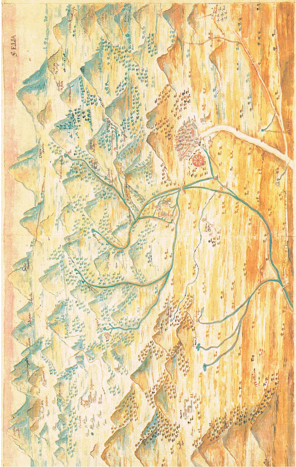
“S. Elia” - Disegnoacquarello di Marcello Guglielmelli (sec. XVIII) - Montecassino, Archivio