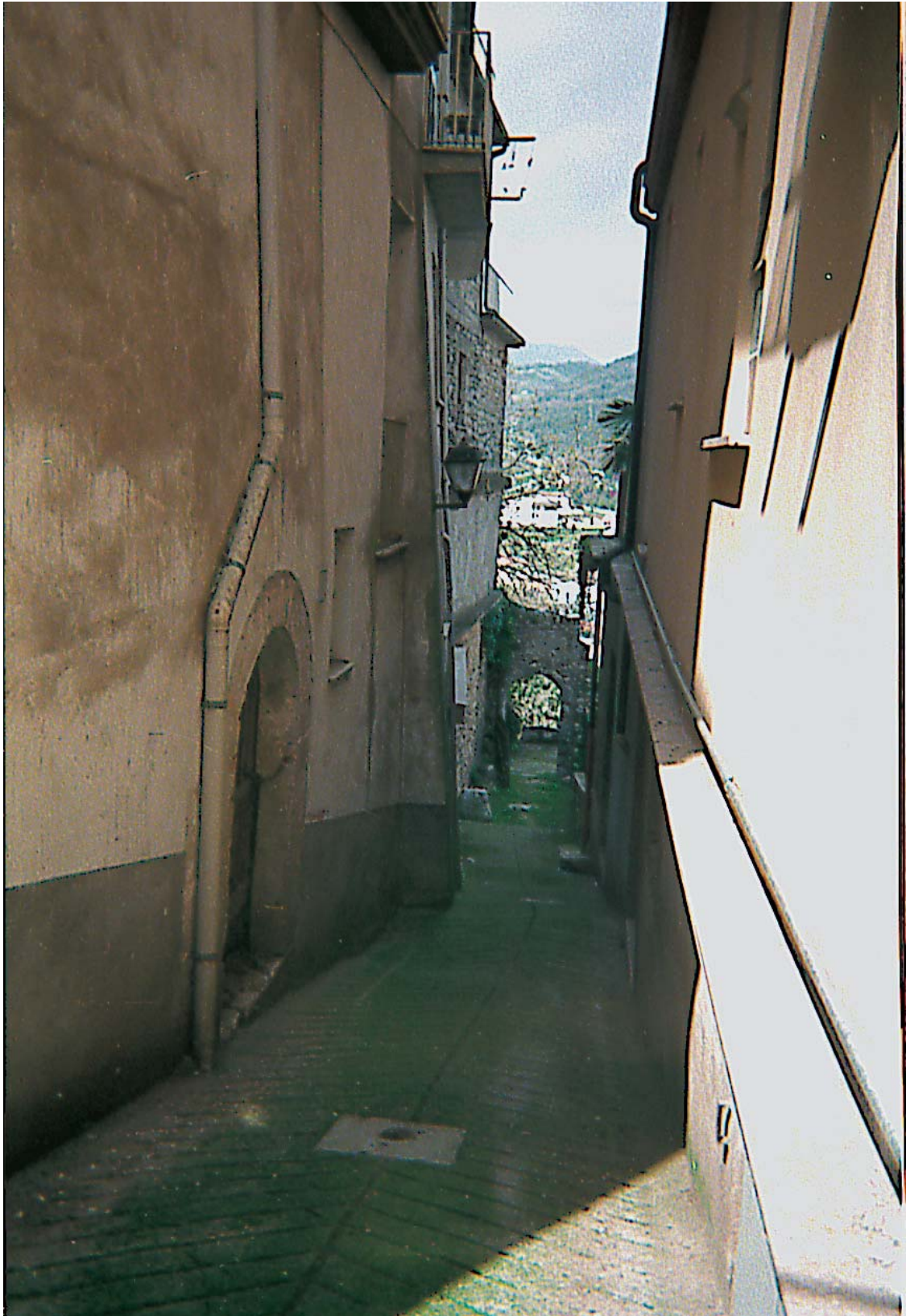
Via 22 ottobre con l'Arco di Porta Nord-Ovest (Portella)