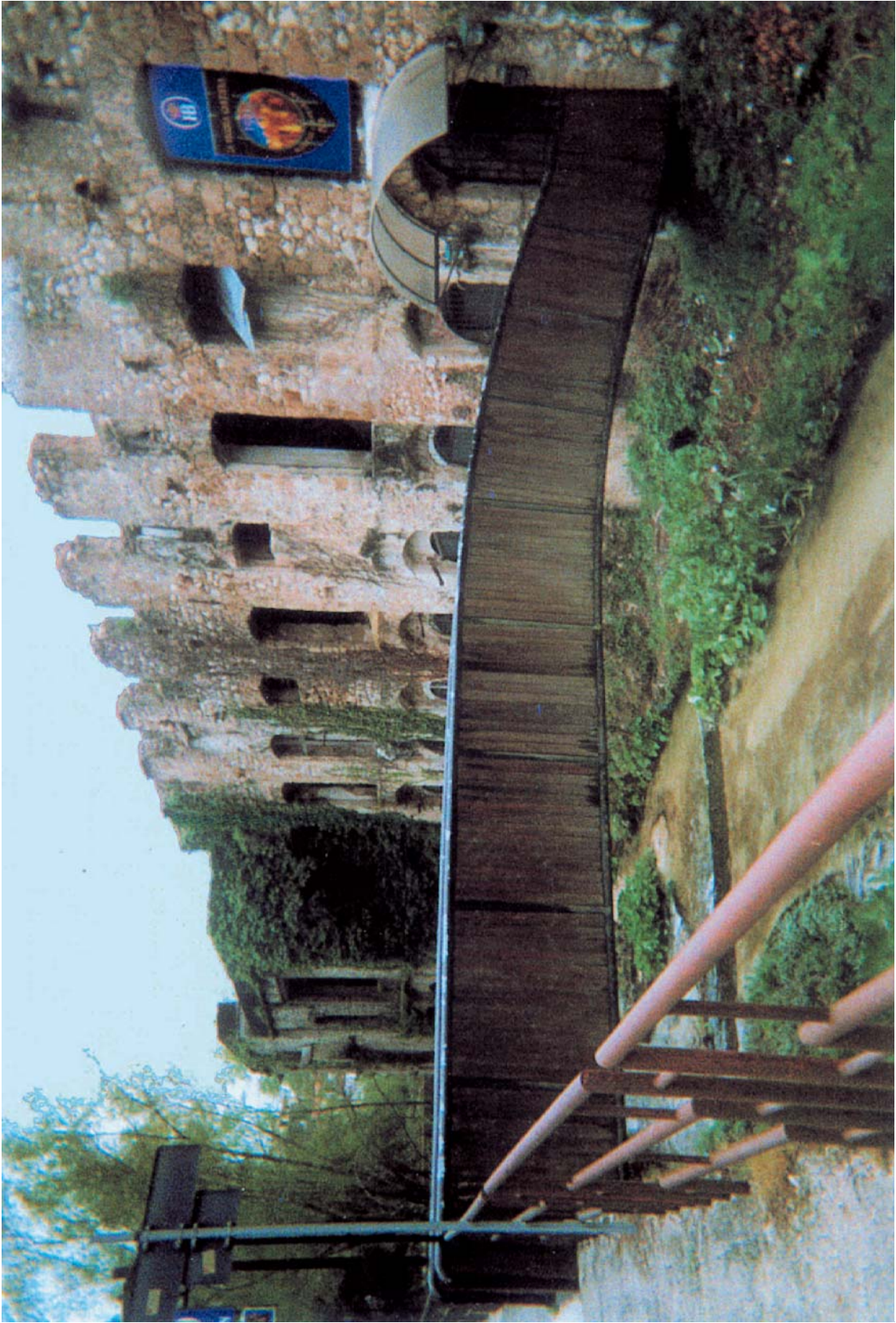
La vecchia Cartiera