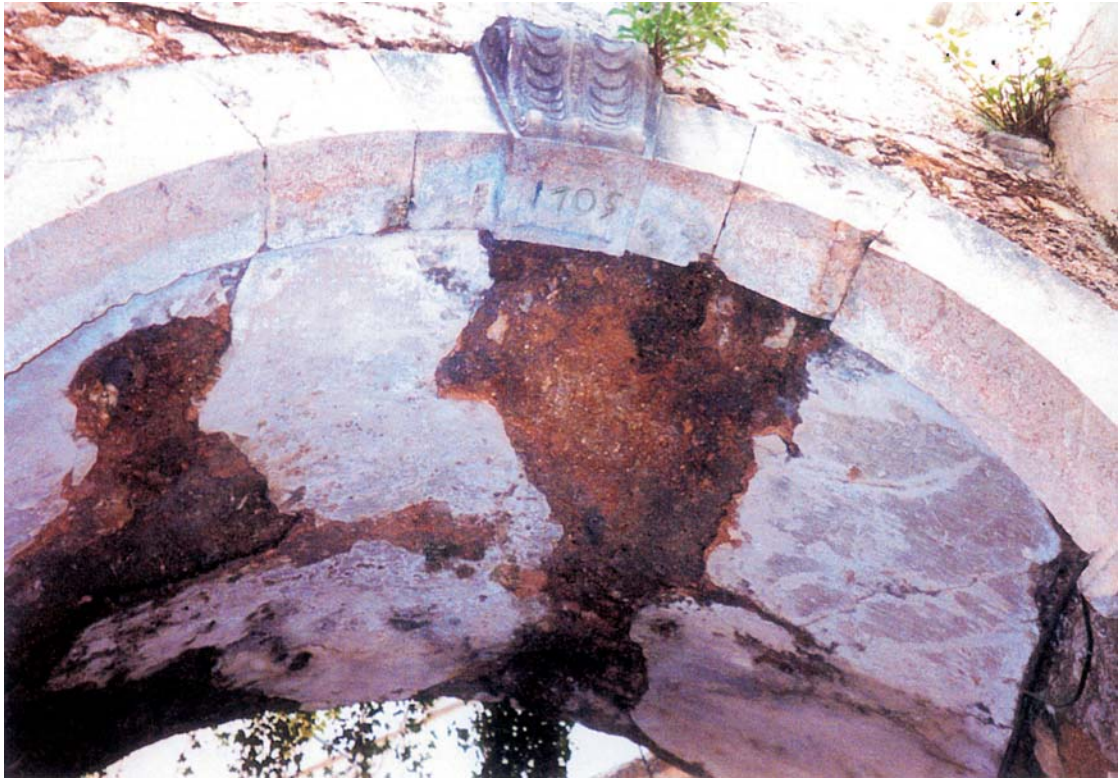
Particolare dell'Arco della Porta di vicolo delle Torri da cui risulta l'anno di costruzione: 1705