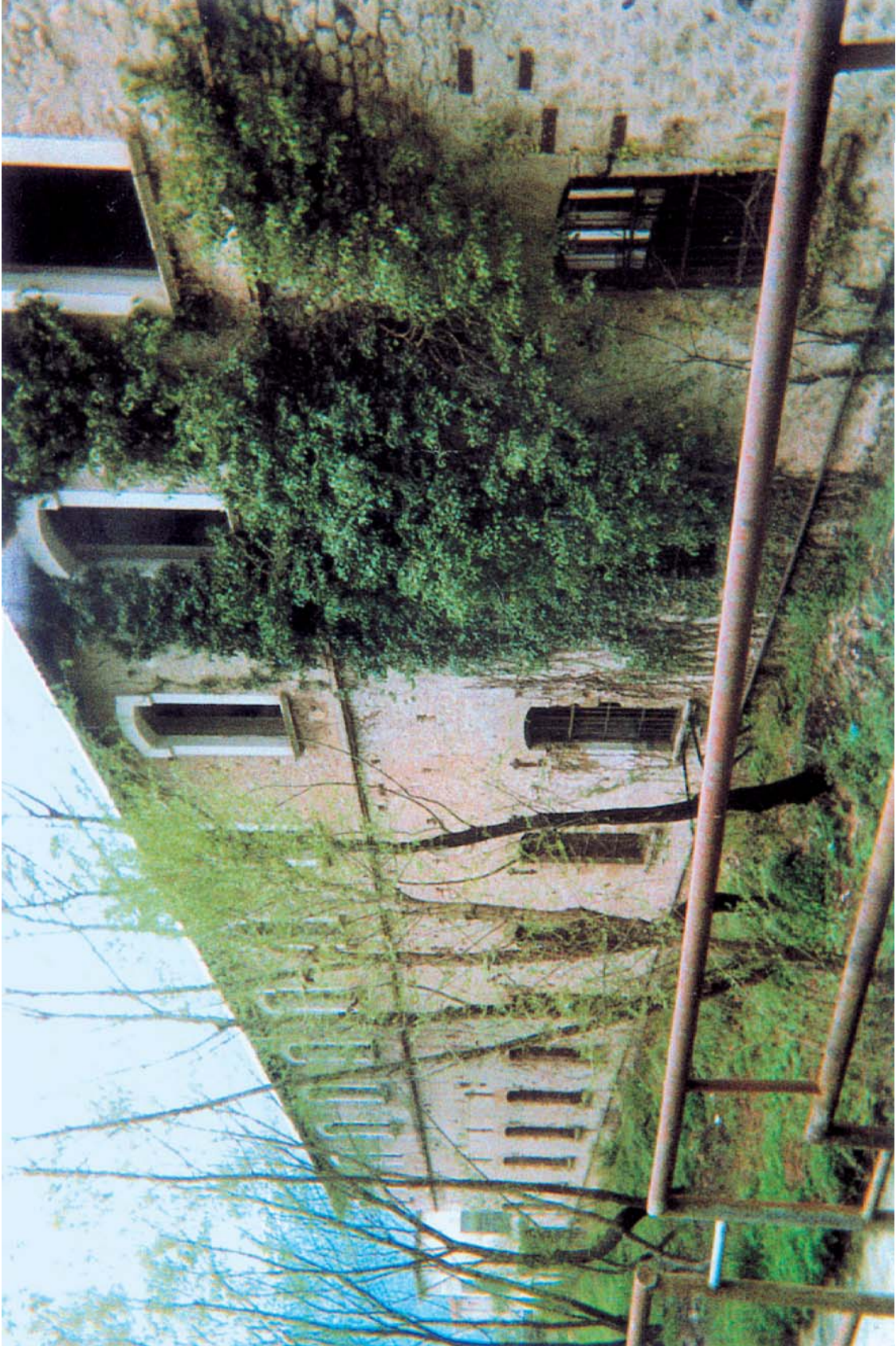
La vecchia Cartiera