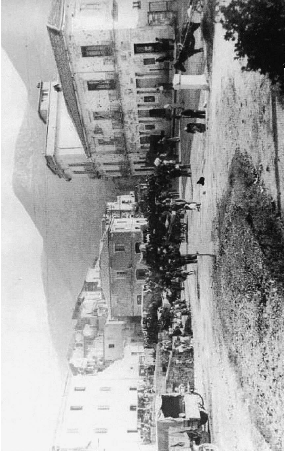
Piazza Risi, primo dopoguerra