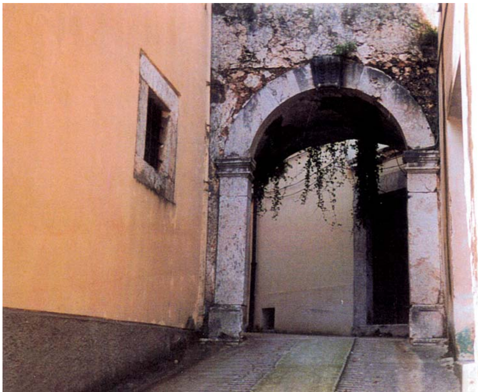
Arco della Porta di vicolo delle Torri. Costruita successivamente alle 3 porte principali.