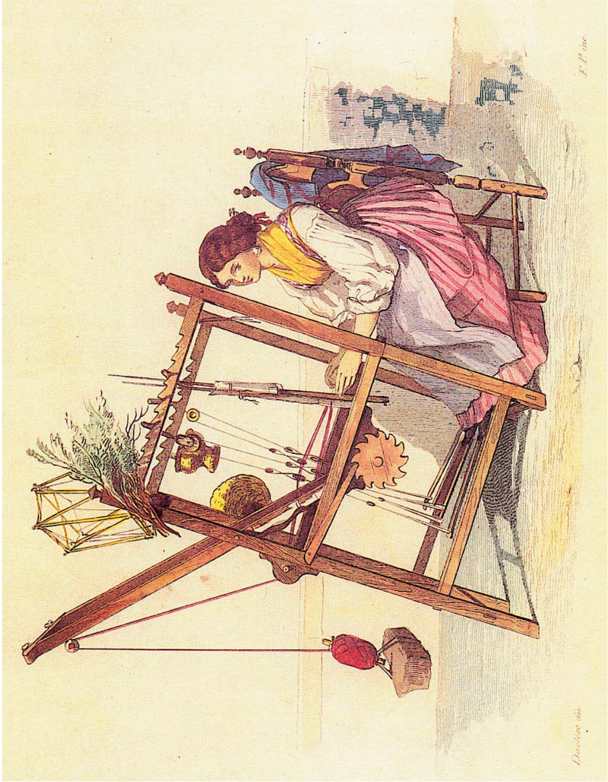
La tessitrice di nastri