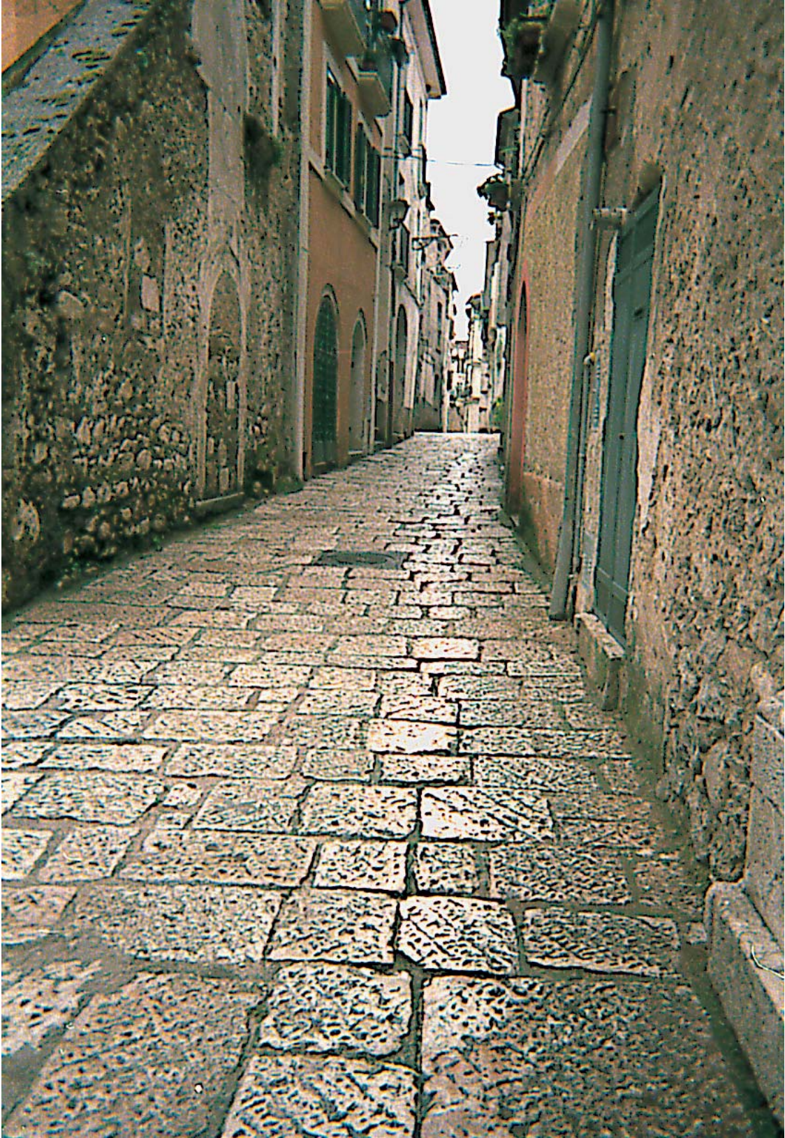
Via A. Santilli