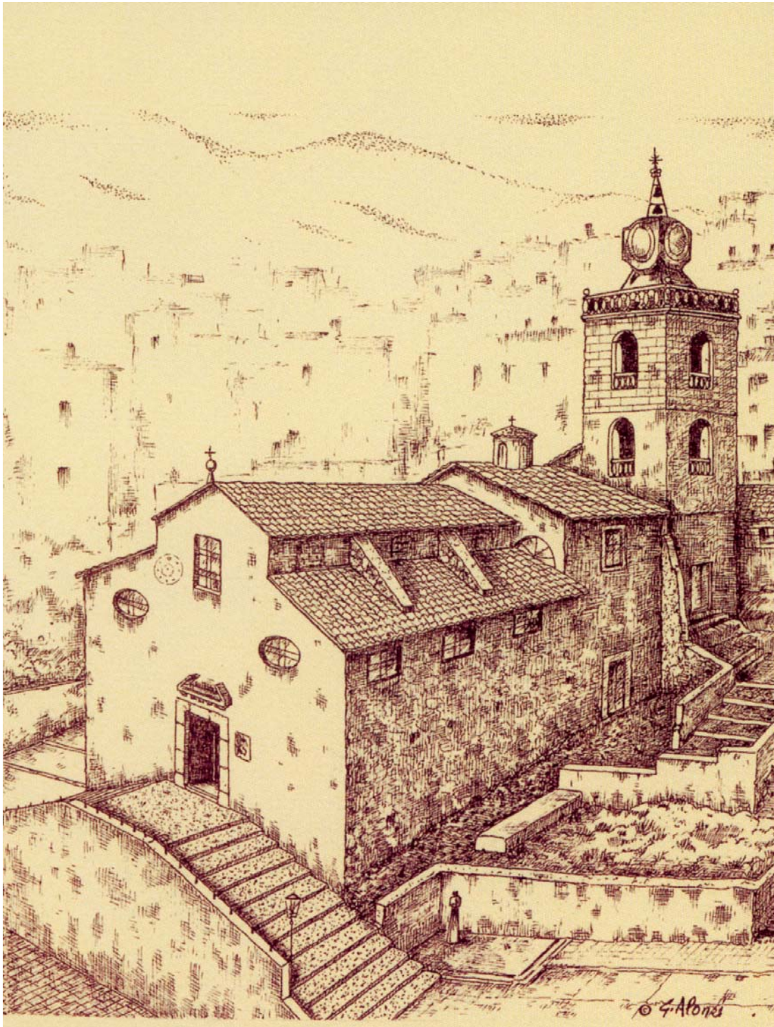
Chiesa S. Maria La Nova.