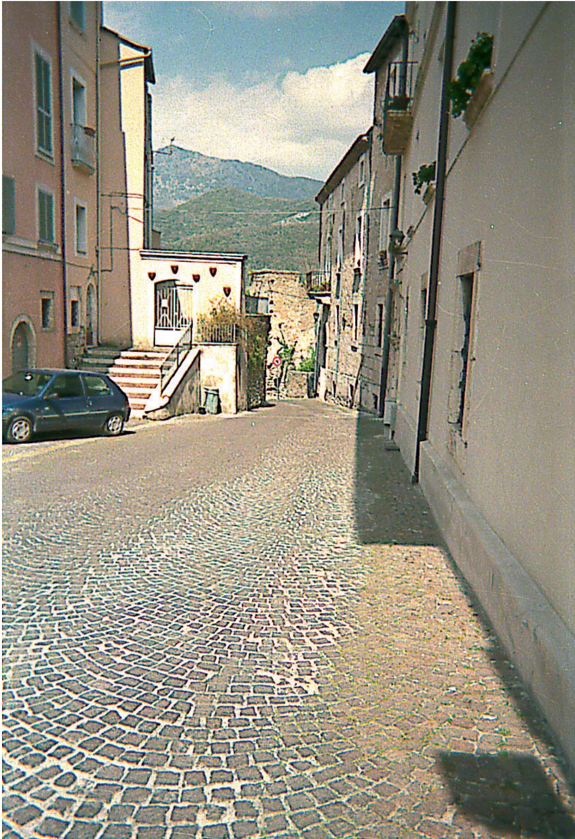
Via delle Torri