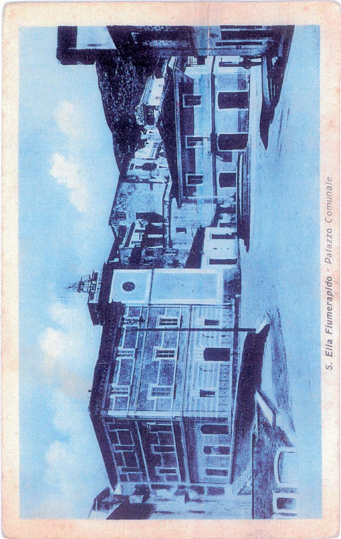
S. Ella Fiumerapido - Palazzo Comunale