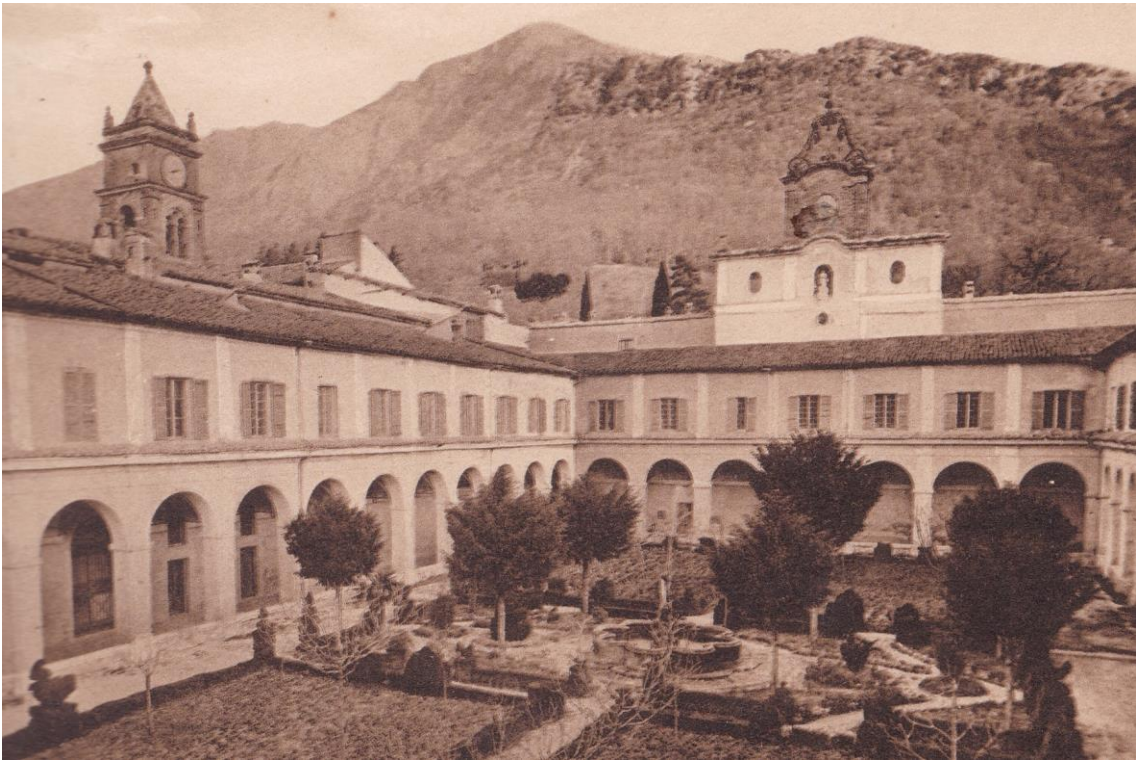
10. Certosa di Trisulti. Il grande chiostro visto dalla galleria.