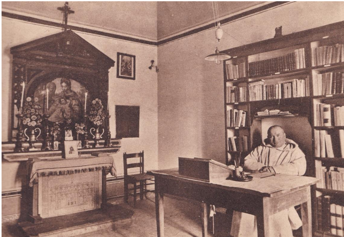
3. Certosa di Trisulti. Interno di una cella con un Monaco.