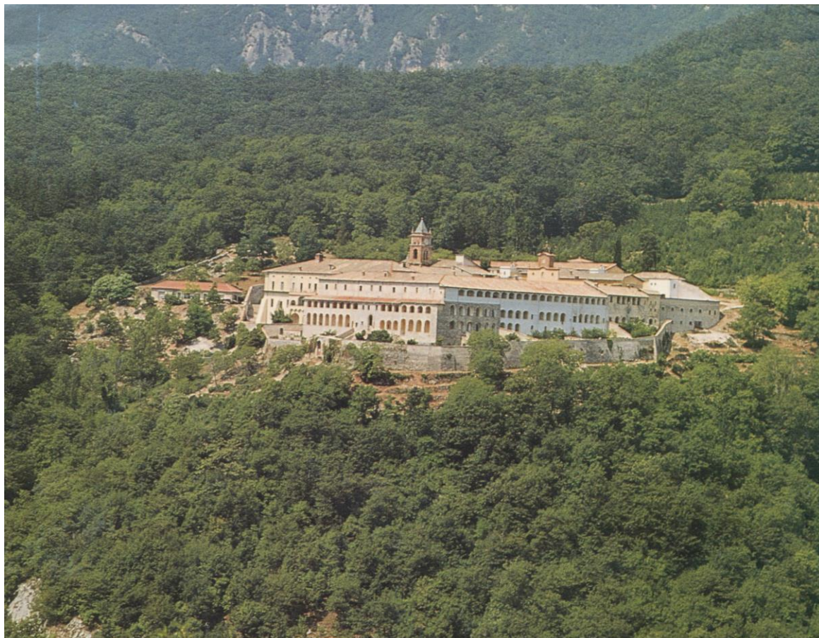
Certosa di Trisulti