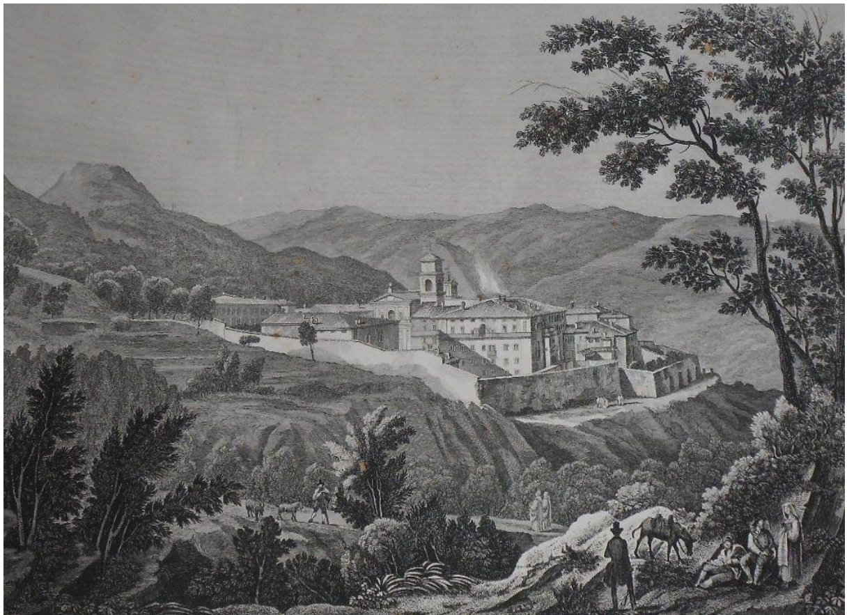
12. Panorama della Certosa di Trisulti in una stampa del 1846.