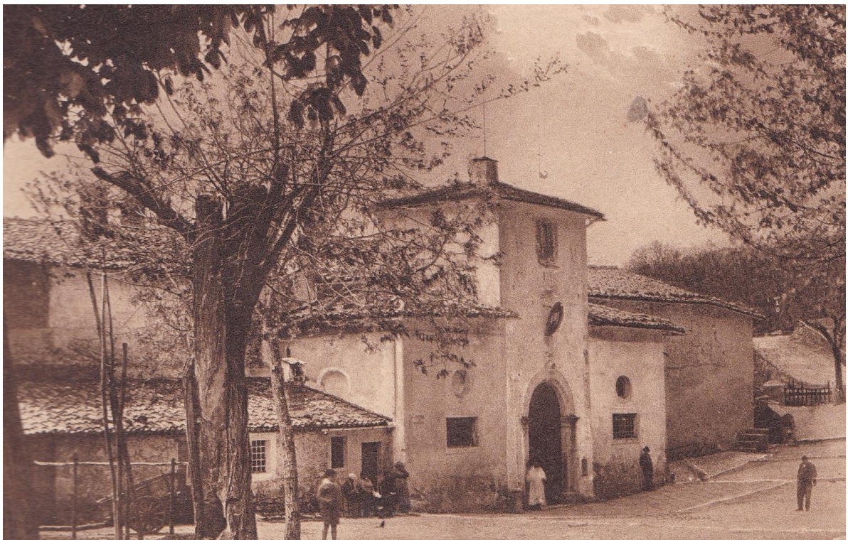
6. Certosa di Trisulti. L'ingresso ad inizio del Novecento.