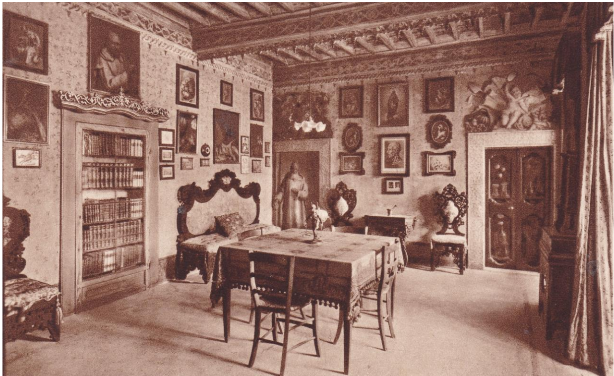
5. Certosa di Trisulti. Salottino della Farmacia con dipinti di F. Balbi.