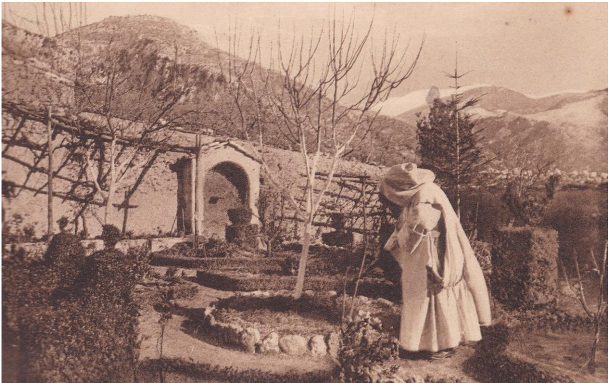
7. Certosa di Trisulti. Giardino di un padre.