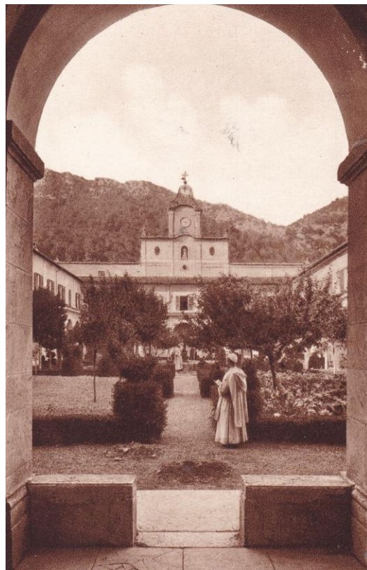
4. Certosa di Trisulti. Giardino del grande chiostro.