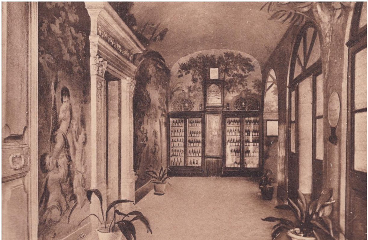
8. Certosa di Trisulti. Corridoio della Farmacia.