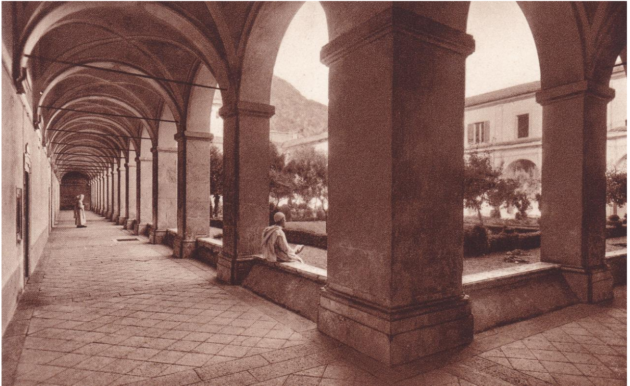
1. Certosa di Trisulti. Il chiostro grande.