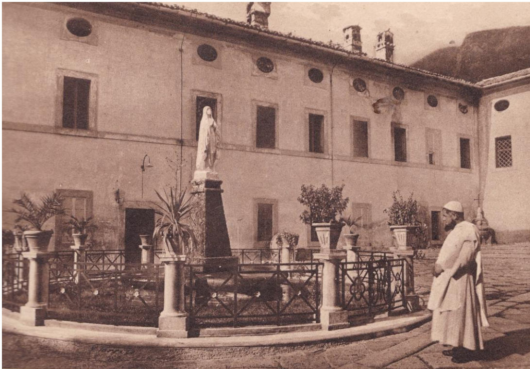
11. Certosa di Trisulti. Monumento all'Immacolata.