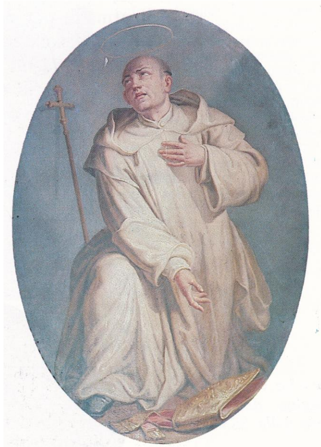
9. Chiesa della Certosa di Trisulti. Dipinto raffigurante il Beato Oddone da Novara.