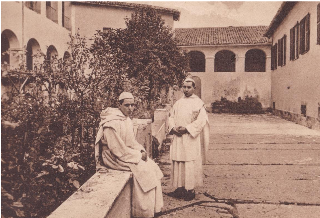
2. Certosa di Trisulti. Cortile della procura con due fratelli conversi.