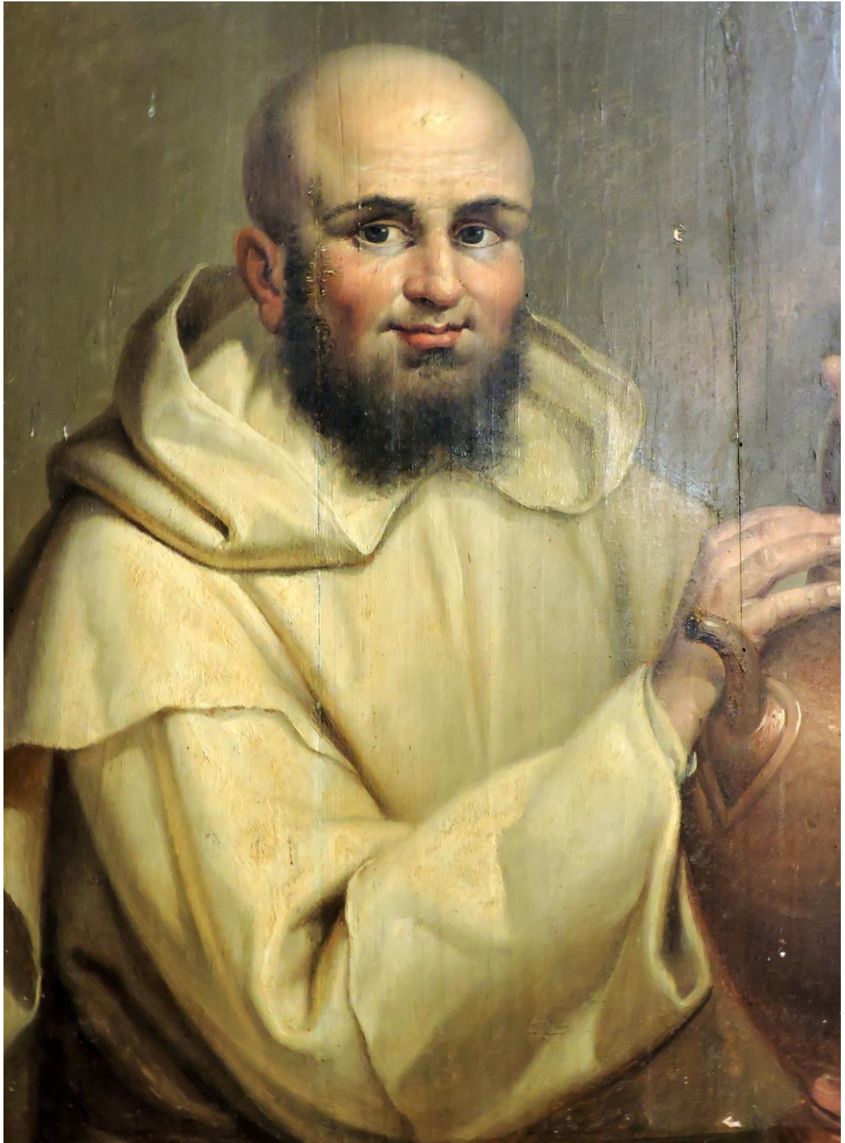
14. Ritratto di Frate Michelangelo dispensiere della Farmacia (F. Balbi).