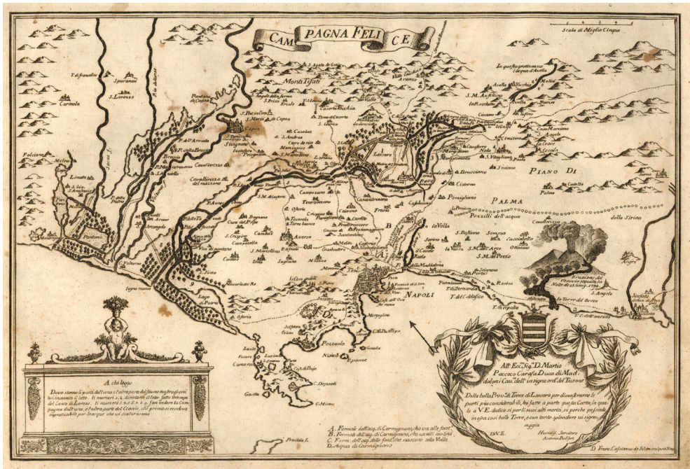
5. Jacob Philipp Hackert, La famiglia reale alla mietitura a Carditello , olio su tela, 1791.