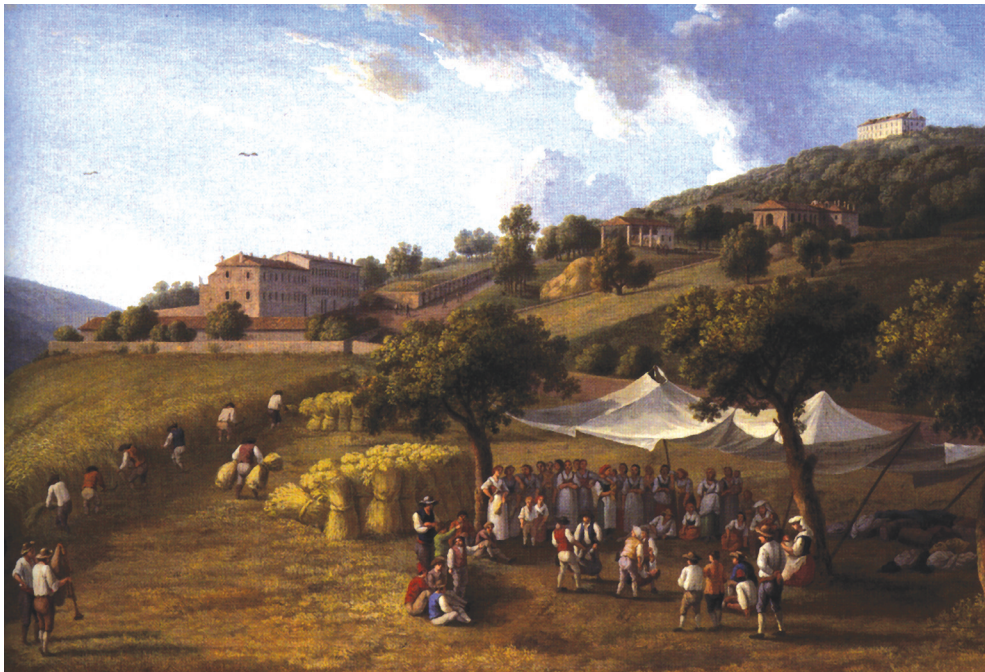
1. Jacob Philipp Hackert, La Reggia di Caserta dal convento dei Cappuccini , gouache su cartone, 1782.