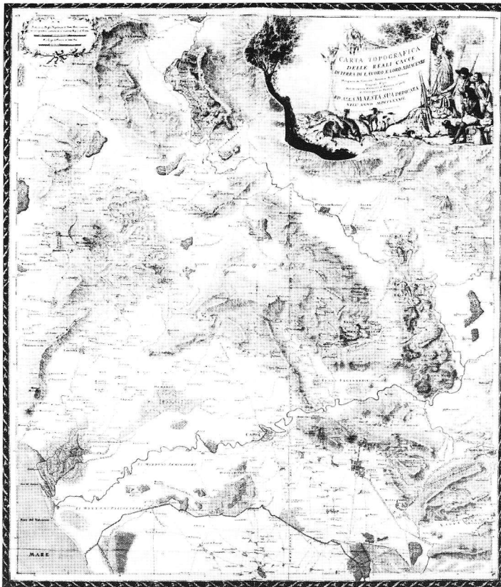
Fig. 1 – A. Rizzi Zannoni, Carta topografica delle Reali Cacce [...], 1774. Biblioteca Nazionale di Napoli.

Con la costruzione del Palazzo Reale che meritava esso solo, a sentire l'Abate Richard de Saint-Non (1776), un viaggio in Italia, si vengono a creare una serie di infrastrutture quali l'Acquedotto Carolino, opera monumentale progettata dall'architetto Vanvitelli, che conduceva e ancora conduce l'acqua al giardino del Palazzo Reale. La carta in esame ci permette di analizzare il percorso del condotto che dalla valle Caudina attraverso la valle di Maddaloni, portava le acque al monte Briano e che da qui venivano riversate nel giardino all'italiana del Palazzo Reale.